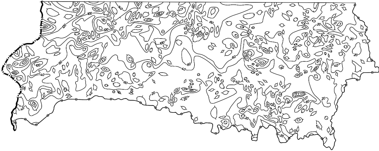
Рисунок 2.2 – Карта-схема мощностей четвертичного покрова

В пределах изучаемой территории четвертичные отложения залегают практически сплошным чехлом. Их мощность составляет 30–50 м, увеличиваясь на западе и северо-западе до 80–120 м (рис. 2.2). Четвертичные отложения отсутствуют на небольших площадях – в районе Столина, д. Глушкевичи и на отдельных фрагментах речных долин.