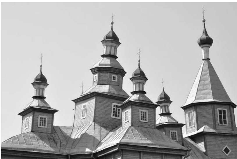
Рисунок 1.40 – Купола Св.-Николаевской церкви в Кожан-Городке

– Видуш-гора – сакральная гора, с южной стороны, недалеко от впадения реки Цны в Припять. Существует предание, что будто тут жил и похоронен изгнанник, римский поэт Овидий , который погиб где-то на Полесье [197].