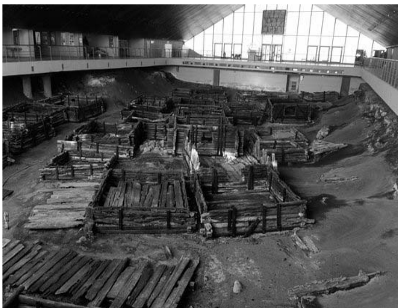
Рисунок 1.6 – Археологический музей «Берестье»

В основе музея – остатки городища древнего города, постройки ремесленного посада XIII века. На территории «Берестья» на глубине 4 м археологами раскопаны улицы, вымощенные деревом, остатки построек различного назначения, находящиеся на площади 1118 м 2 . В экспозиции представлено 28 жилых и хозяйственных бревенчатых строений – одноэтажных срубов из брёвен хвойных деревьев (в том числе два из них сохранились на 12 венцов). Вокруг вскрытого древнего посада размещена экспозиция, посвящённая жизненному укладу славян, населявших в древности эти места, представлены археологические находки, сделанные в ходе раскопок: изделия из металлов, стекла, дерева, глины, кости, ткани, многочисленные украшения, посуда.