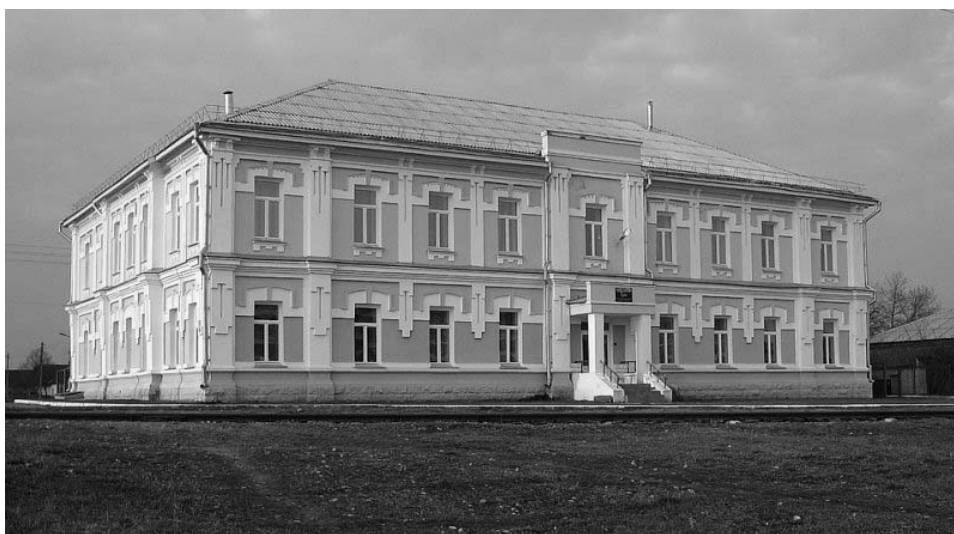
Рисунок 1.48 – г. Жлобин. Дом отдыха локомотивных бригад (нач. XX в.)

В г. Жлобине интересно будет просто прогуляться по улицам города, чтобы увидеть комплекс зданий Белорусского металлургического завода (сер. XX в.), культовые здания – часовню Св. Казимира , Св.-Троицкий собор , дом отдыха локомотивных бригад (начало XX в.) и др. Памятником архитектуры классицизма является Покровская церковь (1807 г.) в д. Стрешин [13].