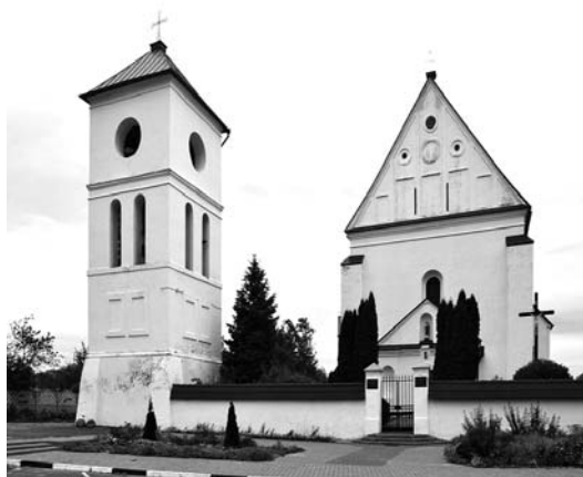
Рисунок 1.10 – Троицкий костел, 1583 г., а. г. Чернавчицы

Кроме усадьбы Немцевичей, в Скоках в Брестском районе следует отметить такие памятники архитектуры, как Троицкий костел (1583 г.) в агрогородке Чернавчицы, церковь Параскевы Пятницы (1610 г.) в д. Збируги, Преображенскую церковь (1609 г.) в д. Шумаки, Св. Михайловскую церковь с колокольней (1701 г.) в Черске и другие.