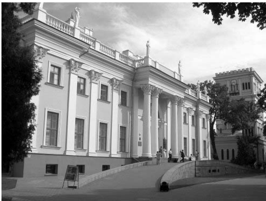
Рисунок 1.50 – Гомель. Дворец Румянцевых-Паскевичей (конец XVIII – начало XIX в.)

Фото: Андрей Дыбовский, июль 2008 г. http://globus.tut.by/gomel/index.htm#palace