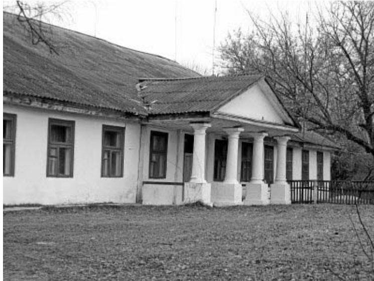
Рисунок 1.24 – Старые Пески. Усадебный дом Пусловских (2-я половина XVIII – 1-я половина XIX вв.)

Фото: Андрей Дыбовский, 2007 г. ( http://globus.tut.by/star_peski/index.htm )