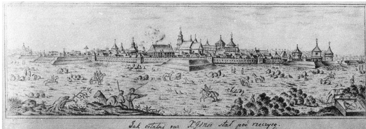
Рисунок 1.47 – г. Речица на гравюре XVII в.

Пограничное положение Речицы определило стратегическое значение города. Крепость, заняв территорию на холме у Днепра, была отгорожена от остальной части поселения рвом, через который перекинут подъемный мост. Сохранившееся изображение середины XVII в. – схематический план панорамы города – дает достаточно полное представление об укреплениях и застройке.