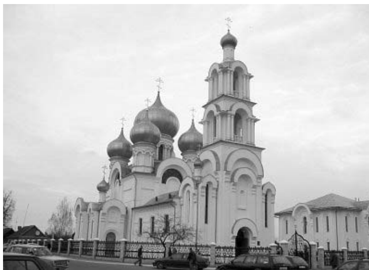
Рисунок 1.21 – Береза. Церковь св. Петра и Павла 1772 г.?, 1867 г., 2003 г.

Фото: Андрей Дыбовский, апрель 2007 г. ( http://globus.tut.by/bereza/index.htm#church )