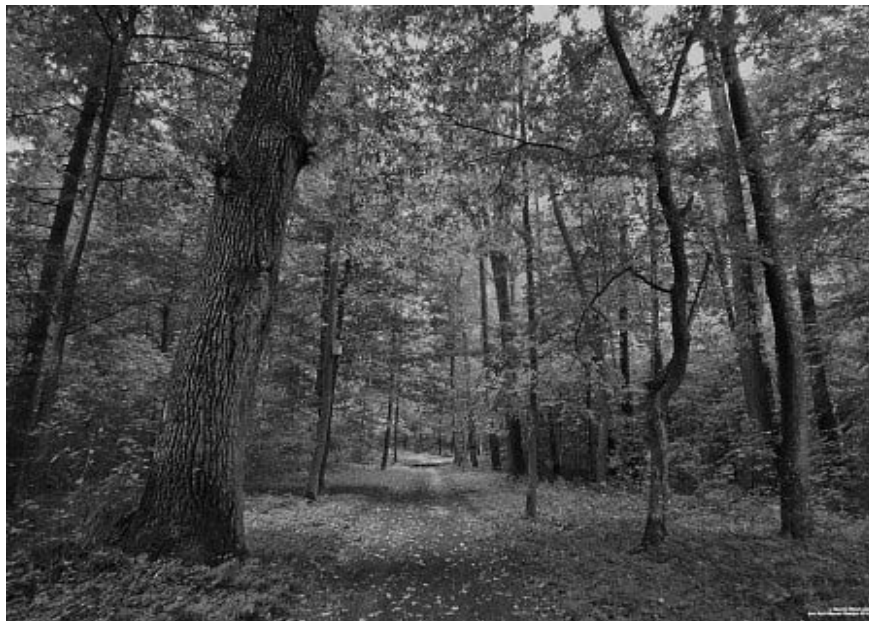
Рисунок 1.35 – Поречье, парк (XIX в.)

В парке около 30 видов деревьев, а также ряд экзотических растений, которые в значительной степени определяют его облик. Возле пруда, на северной окраине парка, растет единственный в республике экземпляр золотистой ели. Ценными породами являются уникальный экземпляр кипариса болотного и 5 тюльпанных деревьев. Из лиственных пород встречаются дуб красный, клен, каштан, бук, ореховые деревья, белая акация и др. Значительный участок парка занят плодовым садом [200].