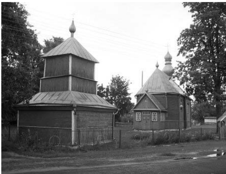
Рисунок 1.17 – Церковь Рождества Богородицы с колокольней, д. Ляховцы

фото: Андрей Дыбовский, апрель 2007 г. ( http://globus.tut.by/lyahovtsy/oldzvon_gallery.htm )