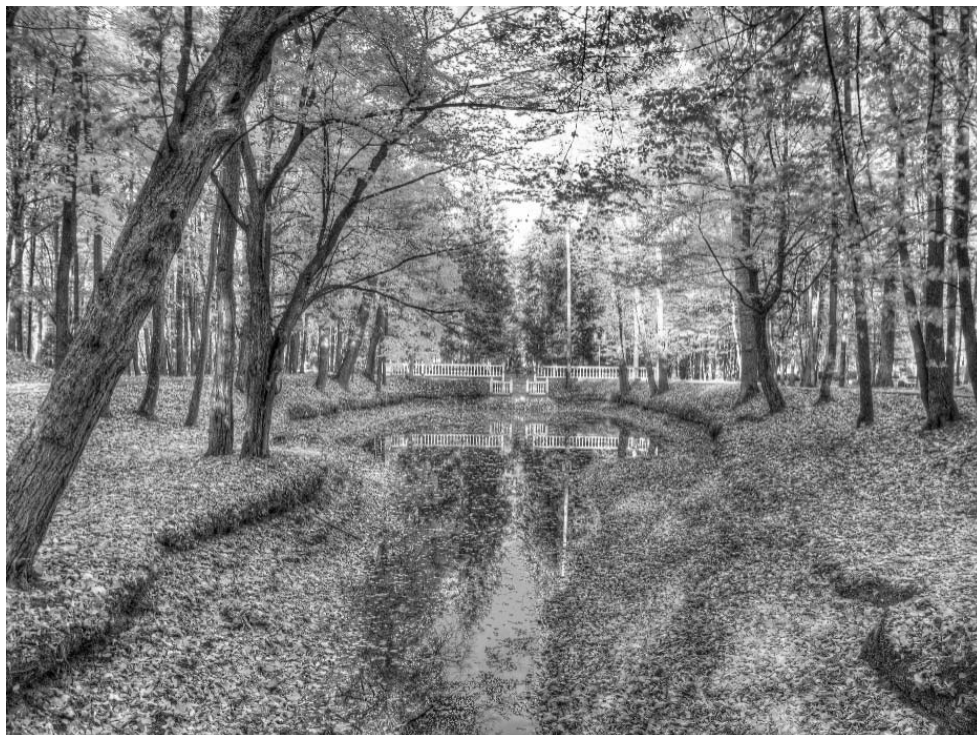
Рисунок 1.16 – г. Кобрин. Парк им. А. В. Суворова

В современном Кобрине находятся также многие другие интересные памятники историко-культурного наследия, в том числе здание бывшего Спасского монастыря (XVII–XVIII вв.), Николаевская церковь (1750 г.), собор Александра Невского (1864–1868 гг.), Петропавловская церковь (начало XX в.), здание бывшей синагоги (вторая половина XIX в.) и, конечно же, бывший усадебный дом А. В. Суворова , в котором сейчас располагается военно-исторический музей, и др. [13].