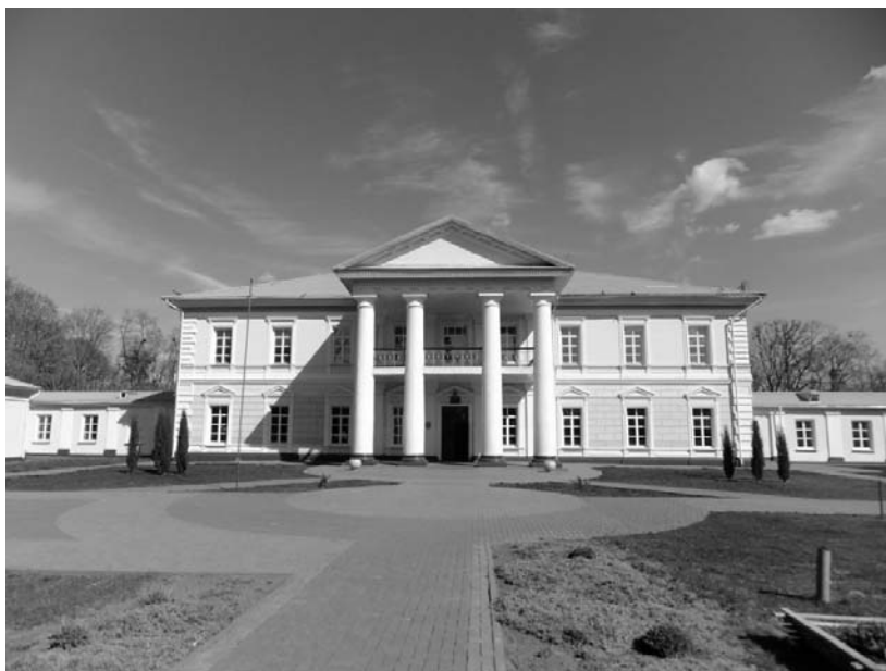
Рисунок 1.46 – д. Переделка, Лоевский район. Усадьба Рудиевских «Сутков»(XVIII–XIX вв.)

Необычайно красив в этих местах Днепр, воды которого за многовековую историю Полесья видели огромное количество людей и событий.