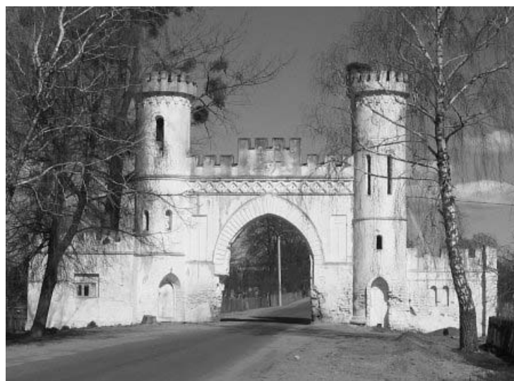
Рисунок 1.23 – Старые Пески. Усадьба. Северная брама (XIX в.)

Фото: Владимир Богданов, август 2002 г. ( http://globus.tut.by/strigin/index.htm )