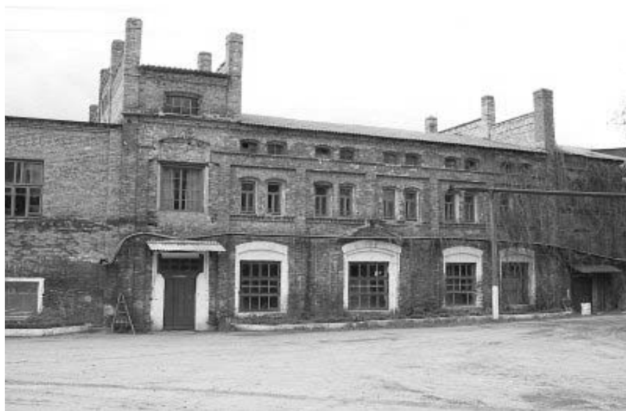
Рисунок 1.36 – Поречье, усадьба: сахарный завод

ней, телег с деревянными колесами, деревянных корыт, ступ и прочей домашней утвари, бортей, уникальных колодцев и многого другого.