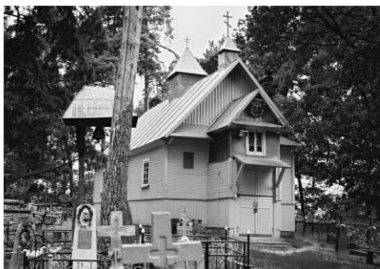
Рисунок 1.22 – Церковь Иоанна Богослова (1817 г.) в д. Стрыгинь, Березовский район

Фото: Андрей Дыбовский, апрель 2007 г. ( http://globus.tut.by/bereza/index.htm#church )