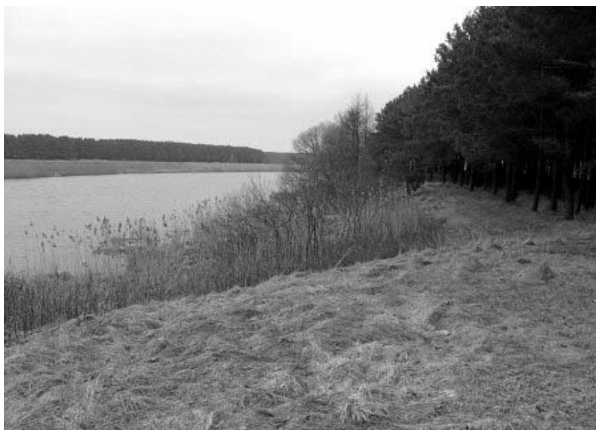
Рисунок 1.28 – Жабер. Фрагменты земляных укреплений замка Вишневецких

Во время Северной войны 1700–1721 гг. войска короля Речи Посполитой Станислава Лещинского, сторонника шведского короля Карла XII, окружили замок и предложили гарнизону сдаться, на что его защитники (700 человек, 40 орудий) ответили орудийными залпами. Шведы окружили крепость плотным кольцом и с помощью тяжелой артиллерии надеялись разрушить бастионы и сломить сопротивление гарнизона, однако этого не понадобилось. Подкупленный комендант замка открыл ворота и сдал его без боя. Карл XII приказал разрушить замок, а орудия заклепать и утопить в обводном рву. Одно из них хранится в Музее Войска Польского в Варшаве [1, 200].