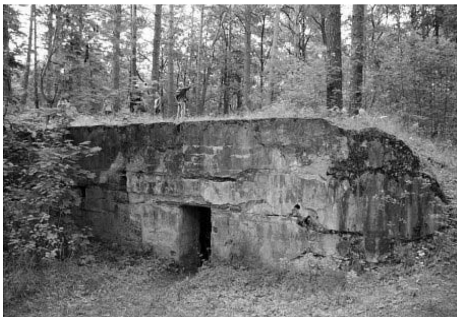
Рисунок 1.37 – Поречье, оборонительные сооружения I мировой войны

Фото: Андрей Дыбовский, май 2005 г. http://globus.tut.by/poreche_pi/