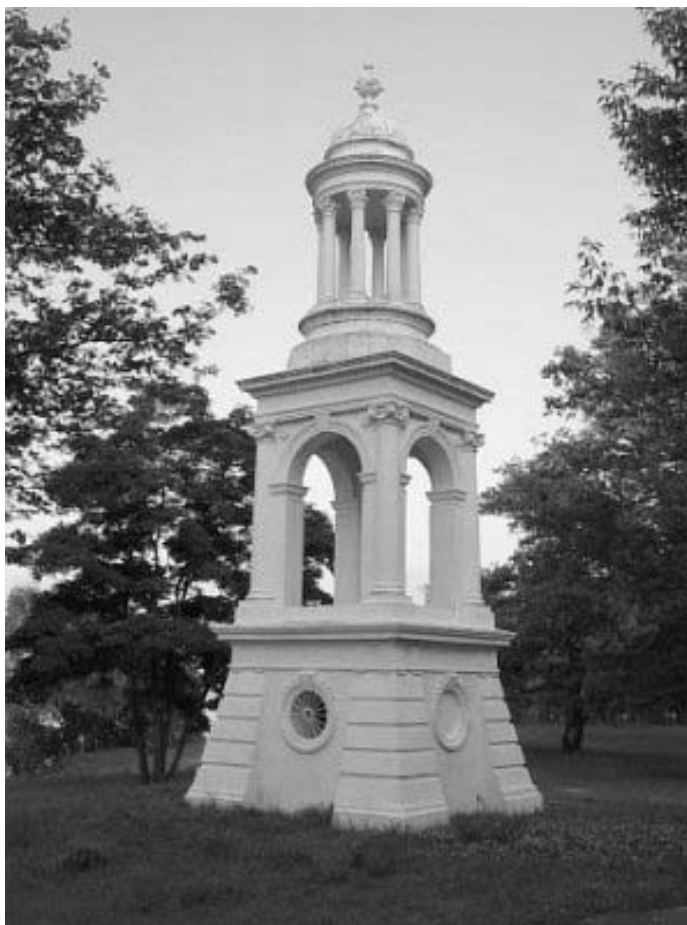
Рисунок 1.45 – г. Наровля. Дворцово-парковый комплекс Горваттов (первая половина XIX в.). Парковая беседка-маяк

Ансамбль включает в себя дворец, построенный в стиле классицизма, парк, фонтан, парковую беседку-маяк, хозяйственные и производственные здания. До 1941 г. главный вход во дворец украшали бронзовые львы, а с северной стороны фасада лежали сфинксы – в годы войны и те и другие были утрачены [13].