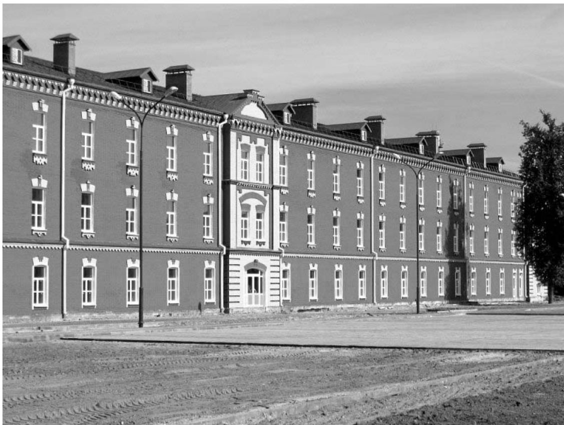
Рисунок 1.20 – Береза. Казармы (2-я половина XIX в.).

На северном берегу оз. Черное на пологом холме в д. Старые Пески находится памятник архитектуры классицизма и садово-паркового искусства пейзажного стиля – бывшая помещичья усадьба Пусловских. Усадебный комплекс сформирован в конце XVIII – начале XIX в. при Казимире Михаиле Пусловском. Ансамбль включает усадебный дом, флигель, браму, конюшню, винокурню. Перед домом вдоль берега озера разбит пейзажный парк (липа, дуб, лиственница, клен, тополь) с системой прудов. Его ландшафт украшали постройки оранжереи «Павильон роз» и ветряной мельницы (не сохранились).