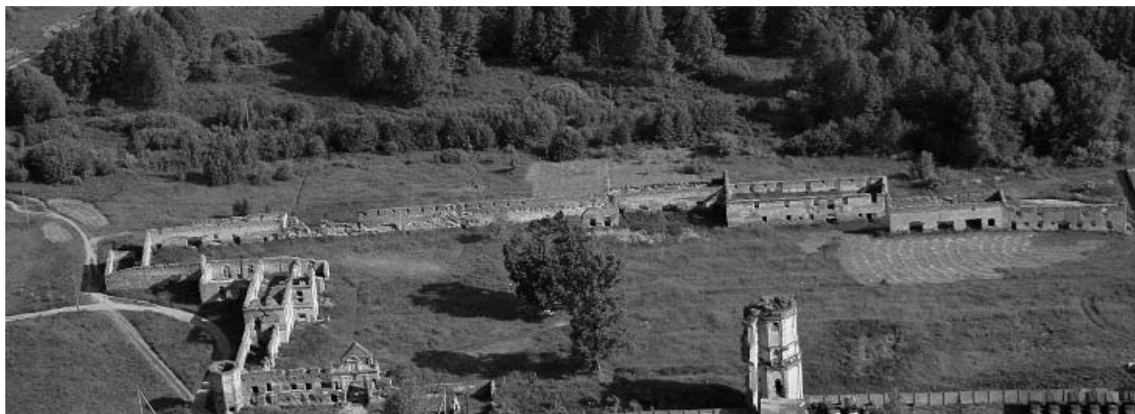
Рисунок 1.19 – Береза. Монастырь картезианцев 1648-1689 гг. (руины). Общий вид

глухой восьмигранный барабан с луковичной главкой. Стены членятся лопатками и прорезаны лучковыми оконными проёмами. Церковь – памятник архитектуры русско-византийского стиля.