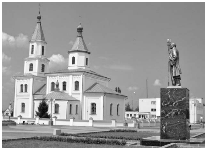
Рисунок 1.30 – г. Иваново. Покровская церковь

Из других достопримечательностей района следует отметить построенную по проекту знаменитого виленского архитектора Т. Растворовского каплицу-ротонду в д. Молодово, расположенную при главном въезде в бывший дворцово-парковый комплекс Скирмунтов (не сохранился); памятник народного зодчества с элементами барокко – деревянную церковь Параскевы Пятницы (XVIII в.) и парк в д. Опаль; Петропавловскую церковь с колокольней (1792 г.) в д. Махро; мемориальную усадьбу, родовое гнездо предков знаменитого писателя Ф. М. Достоевского в д. Достоево и др. [13].