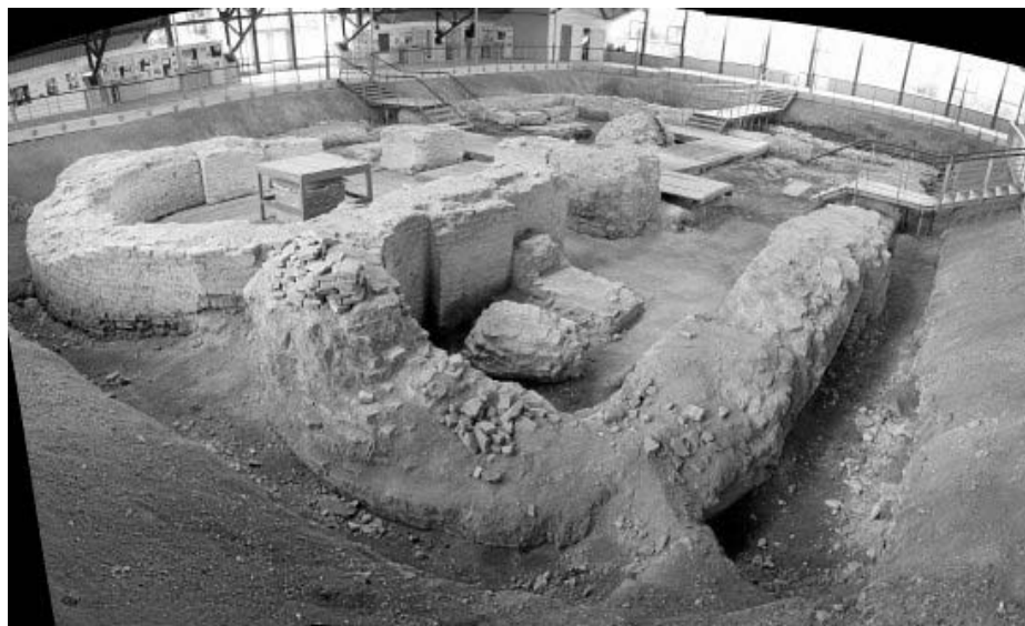
Рисунок 1.41 – Туров. Городище древнего города. Самое крупное монументальное сооружение на территории западных земель Древней Руси. Имеет длину 29,3 м, ширину 17,9 м. Храм был разрушен землетрясением 3 мая 1230 г.

Городище древнего Тулова периода раннего средневековья – один из интереснейших и посещаемых туристами исторических объектов Белорусского Полесья.