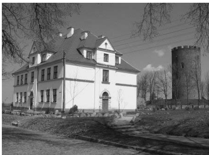
Рисунок 1.13 – г. Каменец, здание гимназии 1931 г. и Каменецкая вежа XIII в.