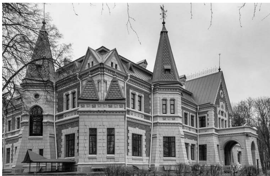
Рисунок 1.49 – Усадебный дом комплекса Готовских в д. Красный Берег (1890-1893 гг.)

Усадебно-парковый комплекс Готовских в д. Красный Берег (1890–1893 гг.) по праву считается одним из красивейших на Восточном Полесье.