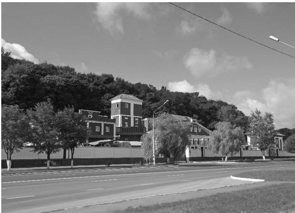
Рисунок 1.44 – г. Мозырь. Комплекс зданий пивзавода (XX в.)

Комплексной историко-культурной ценностью является исторический центр Мозыря (XII–XX вв.): исторические здания и сооружения, планировочная структура, ландшафт и культурный слой. Комплекс бывшего монастыря цистерцианок (1743–1745 гг.), костел и жилой комплекс бывшего монастыря бернардинцев (XVIII в.) и другие памятники архитектуры различных эпох можно с удовольствием изучить, перемещаясь по городу на трамвае.