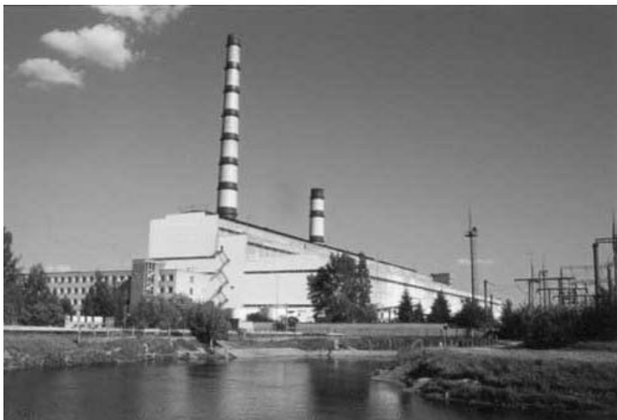
Рисунок 1.27 – Березовская ГРЭС

Березовская ГРЭС мощностью 1600 МВт – крупнейшая тепловая электростанция Беларуси. Она расположена на берегу озера Белого, которое служит для электростанции источником технического водоснабжения и озером – охладителем циркуляционной воды.