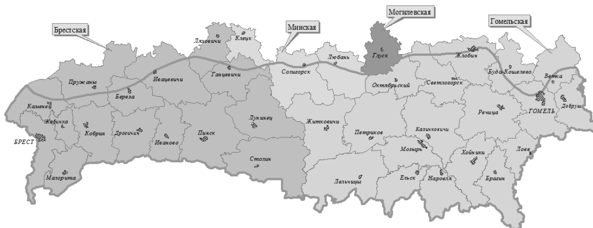
Рисунок 1.53 – Положение Белорусского Полесья в разрезе единиц административно-территориального деления Республики Беларусь