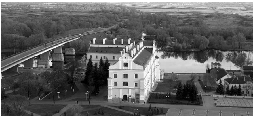
Рисунок 1.34 – Пинск. Музей Белорусского Полесья

Фото: Андрей Дыбовский, март 2008 г. http://orda.of.by/.add/gallery.php?ivacevichi/struve