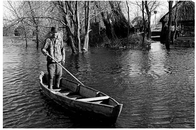
Рисунок 1.38 – Типичное Полесье