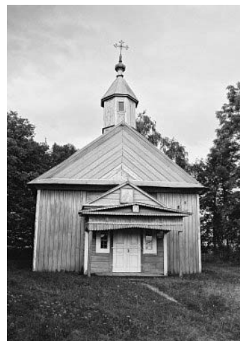
Рисунок 1.26 – Церковь Усекновения главы Иоанна Предтечи (1820-е гг.) в д. Соколово, Березовский район

Фото: Владимир Богданов, август 2002 г. ( http://globus.tut.by/sokolovo/church_gallery.htm )