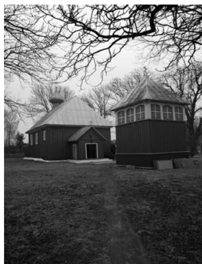
Рисунок 1.11 – Церковь Параскевы Пятницы, 1610 г., д. Збируги

Всего в нескольких десятках километров от Чернавчиц, уже в Каменецком районе, расположена деревня Волчин, которая известна, и чаще всего упоминается, как место рождения и захоронения останков последнего короля Речи Посполитой – Станислава Августа Понятовского (1732–1798).