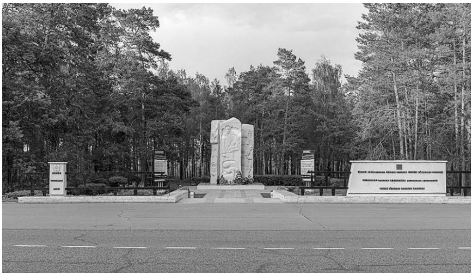
Рисунок 1.43 – Мемориальный комплекс узникам лагеря смерти «Озаричи»

Переместившись в один из старейших городов на Полесье – Мозырь, административный центр Мозырского района, путешественник попадает в удивительно красивый природный и городской ландшафт. Мозырь расположен на холмистой местности в пределах Мозырской гряды. На территории города размещается крупнейший в Беларуси речной порт Пхов на реке Припять.