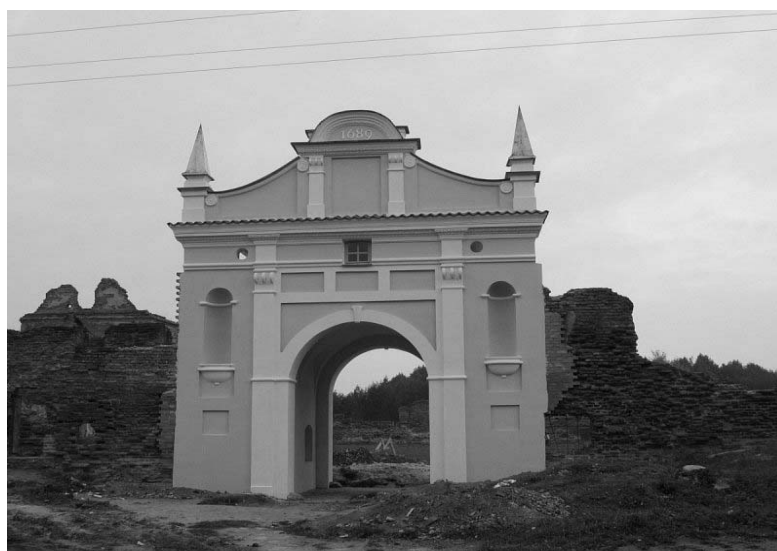
Рисунок 1.18 – Береза. Монастырь картезианцев. Брама

В первоначальном виде ансамбль монастыря существовал до 1863 г. В наказание за активное участие в восстании монахов-картезианцев их костел и почти весь монастырь были разобраны, а полученный кирпич использован для строительства казарм. Сейчас сохранились лишь фрагменты комплекса, но и они дают представление о былом величии памятника барочной архитектуры.