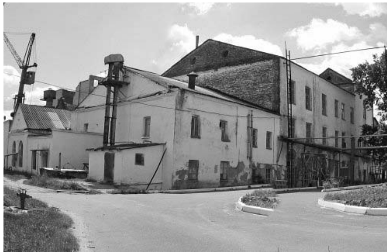
Рисунок 1.25 – Старые Пески. Винокурня (XIX вв.)

Фото: Андрей Дыбовский, 2007 г. ( http://globus.tut.by/star_peski/index.htm )