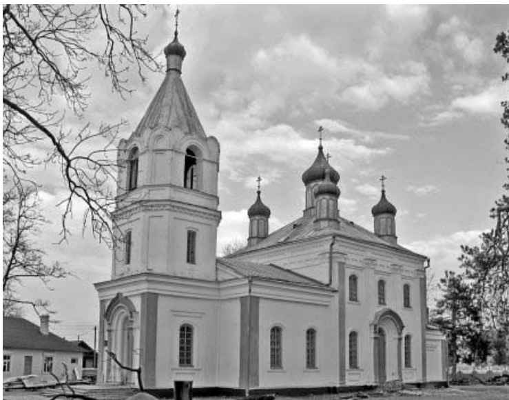
Рисунок 1.31 – Мотоль, церковь Спасо-Преображенская (1877 г.)

Фото: Андрей Дыбовский, март 2009 г. http://globus.tut.by/motol/index.htm