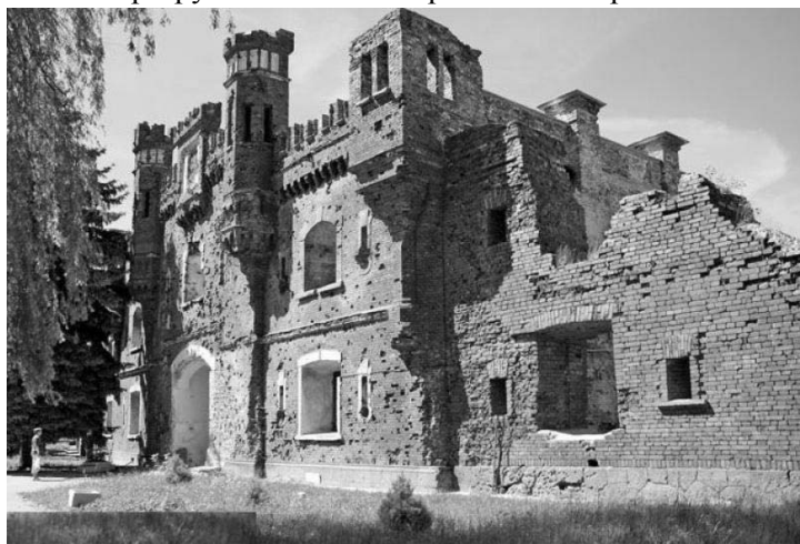
Рисунок 1.8 – Холмские ворота Брестской крепости

С 1921 г. в крепости размещались части польской армии, которые с 14 по 17 сентября с честью обороняли крепость от частей немецкой 10-й танковой армии. В ходе боев часть сооружений Цитадели была разрушена. 22 сентября 1939 г. в крепость вошла Красная Армия.