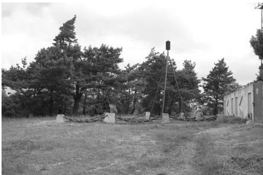
Рисунок 1.33 – Пункт геодезической дуги Струве «Ивацевичи»

Фото: Андрей Дыбовский, март 2008 г. http://orda.of.by/.add/gallery.php?ivacevichi/struve