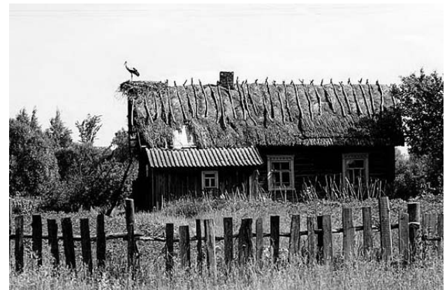
Рисунок 1.39 – Деревня Кудричи

Эта деревня могла стать изюминкой белорусского туризма. Однако, к сожалению, сегодня она больше напоминает дачный поселок, что дает повод некоторым представителям турбизнеса с сожалением говорить о смерти этой достопримечательности.