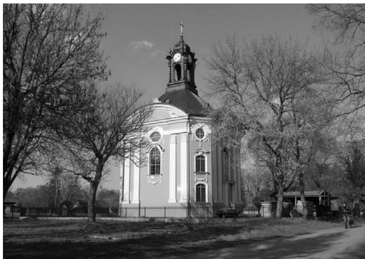
Рисунок 1.12 – Св. Троицкий костел, 1733 г., д. Волчин

Также по-своему выразительны и уникальны и другие храмы в этих местах: Николаевская церковь в Больших Сехновичах (до 1727 г.), Св. Михайловская церковь в д. Степанки (до 1780 г.), Преображенская церковь в д. Хмелево (1725 г.), деревянная церковь с колокольней (1720–1860 гг.) в Мациевичах и другие.