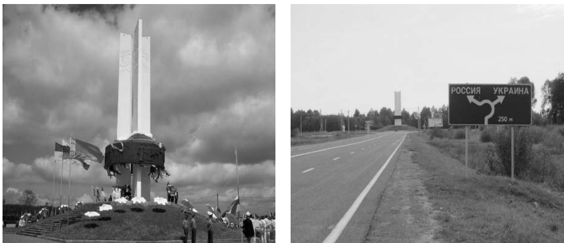
Рисунок 1.52 – Памятник на границе трех стран. Веселовка, Добрушский район, Гомельская область http://globus.tut.by/veselovka/index.htm#pomnik

Памятник на границе трех стран (1975 г.) в населенном пункте Веселовка Добрушского района Гомельской области завершает наш краткий (и, возможно, субъективный) обзор исторических и культурных памятников Белорусского Полесья.