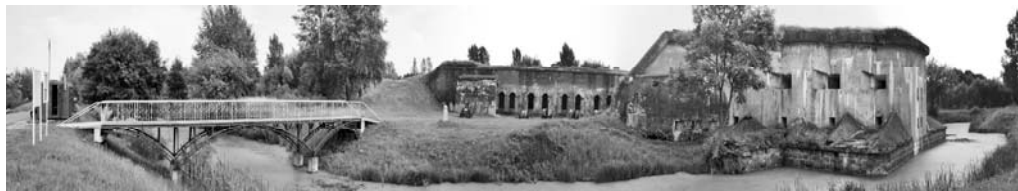
Рисунок 1.7 – V форт Брестской крепости

В середине XIX века, в связи с развитием артиллерии, крепость стала доступной пушкам на всю глубину ее территории. Для ее защиты было принято решение о постройке пояса из девяти фортов, расположенных в 3–4 км друг от друга и отдаленных от крепости на 3–5 км.