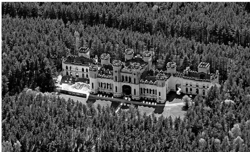
Рисунок 1.32 – Меречевщина. Дворец Пусловских (XIX в.)

Совершая прогулку по городу, обязательно стоит побывать во дворце Бутримовича (1784–1790 гг.); монастыре бернардинцев ; в единственной на территории бывшего ВКЛ святыне « монахов-коммунистов » – костеле Карла Баромея , музее Белорусского Полесья , который был основан в 1926 г. и расположен в здании бывшего Коллегиума иезуитов (1631–1675 гг.) и других многочисленных исторических объектах.