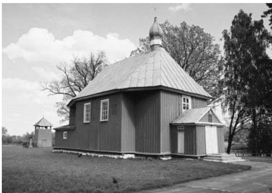
Рисунок 1.14 – Св. Никитская церковь в д. Здитово

Будучи в Жабинковском районе, следует также посетить расположенный в Малых Сехновичах музей, что бы увидеть единственный на территории современной Беларуси памятник Тадеушу Костюшко (если не считать памятник, установленный в посольстве США). Этот бюст нашего знаменитого земляка изготовлен в 1932 г. скульптором Бальбиной Видецкой-Свитич и был установлен на постаменте в г. Кобрин. Однако в советские годы его демонтировали с глаз долой – вероятно, чтобы не отвлекал внимание от «правильного» восприятия памятников Александру Суворову. Лишь в 1988 г. он был перевезен и установлен в Малых Сехновичах.