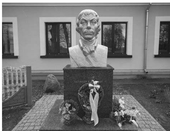
Рисунок 1.15 – Памятник Т. Костюшко у входа в музей в д. Малые Сехновичи

В Кобрине никого не оставит равнодушным прогулка по историческому центру города и парку им. А. В. Суворова .