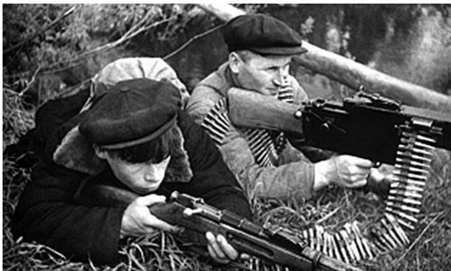
Рисунок 2 – Партизаны в засаде

Образование партизанского движения и подпольной борьбы подчеркивает дружбу и братство советского народа.