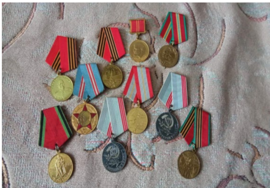
Рисунок 2 – Награды А. Р. Карповича

ство, проявленные в борьбе с немецко-фашистскими захватчиками. И много еще медалей.