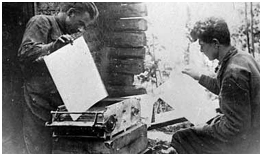
Рисунок 3 – Подпольная антифашистская типография