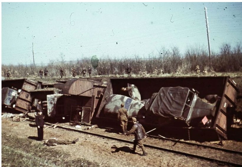
Рисунок 1 – Сошедший с рельсов эшелон с техникой в результате операции «Рельсовая война»

Диверсионная деятельность и разрушение инфраструктуры врага в любой форме занимали ведущее место. Крупномасштабной операцией является «Рельсовая война», в результате которой были пущены под откос более десятка тысяч воинских эшелонов врага, подорвано сотни железнодорожных мостов и перебито более трехсот тысяч рельсов, что на некоторое время затруднило перемещение врага.