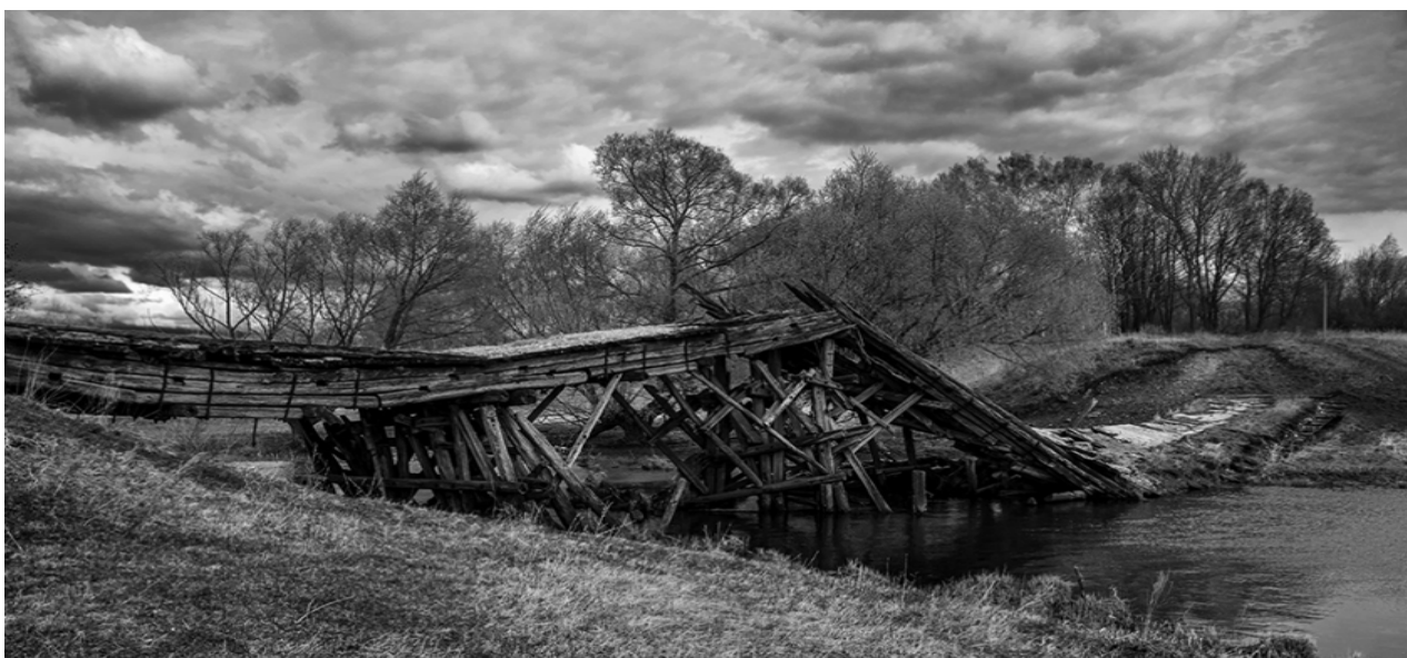
Фота 2 – Мост праз раку Піну каля Пінска, пачатак 1940-х гадоў

Прышла нядобрая вестка – пачалася вайна. Арсеній Іванавіч разам з іншымі будаўнікамі па чарзе дзяжурылі і днём і ноччу, аберагаючы шлюзы. Немцы наступалі ўсё бліжэй і бліжэй. Адночы немцы вельмі моцна пачалі бамбіць мост. Бригадзір загадаў усім бегчы на іншы бок маста (фота 2). Многім не ўдалося перайсці мост, а Арсенію Іванавічу і яшчэ двум яго таварышам пашчасціла, і яны засталіся жывыя. Немцы поўнасьцю знішчылі мост і шлюзы. Арсеній Іванавіч з таварышамі вяртаўся ў родную вёску. Яны ішлі днём і ноччу, калі прыйшлі ў вёску, то ўбачылі, што некаторыя дамы былі спалены. Маці Арсенія Іванавіча, яго бацьку, брата з яго дзецьмі немцы расстралялі. Але мой прадзед застаўся ў вёсцы і разам з іншымі сялянамі стаў аднаўляць яе з папялішча.