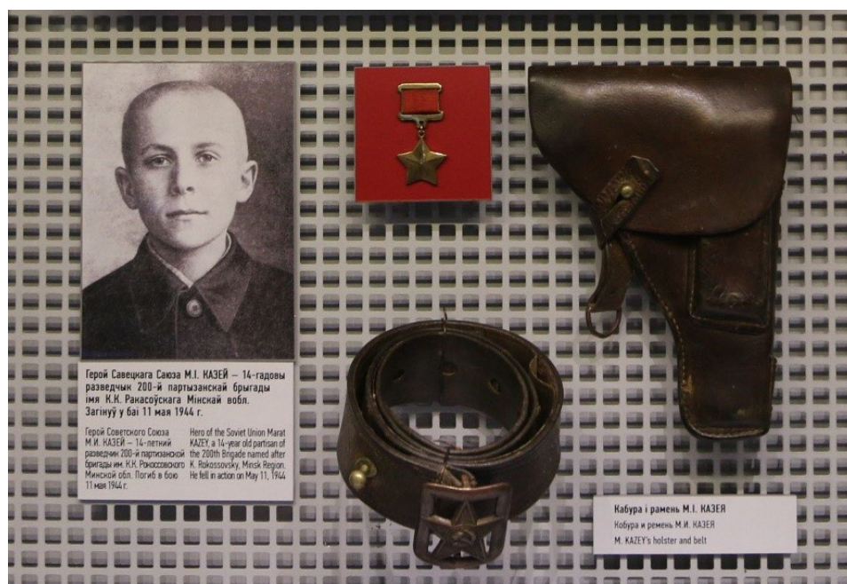
Рисунок 2 – Фотография, ремень и кобура Марата Казея в Белорусском государственном музее Великой Отечественной войны