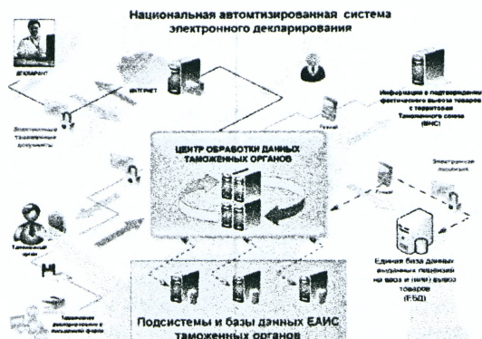
Рисунок 3 – Схема взаимодействия основных компонентов НАСЭД