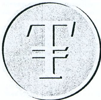
Рисунок 2 – Логотип первой криптовалюты Республики Беларусь (Талер) [3]

Талер (TLR) – децентрализованная электронная криптовалюта, которая не имеет единого центра управления и эмиссии. Функционирует валюта в онлайн-сети. Обмен талерами между пользователями – это передача зашифрованных данных.