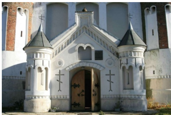
Рисунок 3 – Главный вход в церковь-крепость

Хронология ремонтных и исследовательских работ с описью элементов храма: