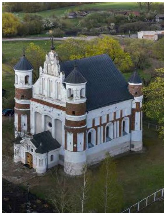
Рисунок 1 – Церковь-крепость в д. Мураванка

9. Палацава-паркавы ансамбль: замак-палац, брама, прыбрамныя карпусы, паўночна-ўсходняя і паўднёва-заходняя галерэі, льядоўня, стайня; абарончыя збудаванні і мост; тэрыторыя паркаў: Замкавы, Стары, Японскі, Англіійскі, Новы; водная сістэма: Дзікі, Замкавы, Бернардзінскі ставы. XVI–XIX стагоддзі. Мінская вобласць, Нясвіжскі раён, г. Нясвіж [1].