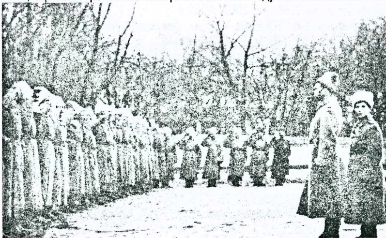
Царский смотр Георгиевских кавалеров в Ставке

10 августа 1913 года Император Николай II утвердил новый Статут комплекса наград, которые официально стали называться Георгиевскими. В числе этих отличий был солдатский крест четырех степеней, названный также Георгиевским. Нумерация новых наград должна была вестись заново, отдельно по каждой степени. Выдача особых крестов для нехристиан была прекращена, так как само название «Георгиевский» предполагало изображение на кресте Св. Георгия. Причём до 1916 награды делались из золота и серебра, после из жёлтого и белого металлов. Из общего числа отчеканенных до начала 1917 года Георгиевских крестов (1573725 шт.) в Главный Штаб было отправлено 1186283 знака, в Главный Морской Штаб – 3871 и в Военно-походную канцелярию Императора Николая II – 289535 знаков, а всего 1479739 крестов всех степеней. Практически все они были вручены нижним чинам и унтер-офицерам за мужество и героизм, проявленный в боях на фронтах Первой мировой. Новый статут ввёл также пожизненные денежные поощрения кавалерам Георгиевского креста: за 4-ю степень — 36 рублей, за 3-ю степень — 60 рублей, за 2-ю степень — 96 рублей и за 1-ю степень — 120 рублей в год. Кавалерам нескольких степеней прибавка или пенсия платились только за высшую степень. На пенсию в 120 рублей можно было нормально жить, зарплата промышленных рабочих в 1913 году составляла около 200 рублей в год.