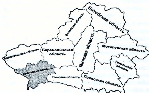
Беларусь в 1940 г.

Территория современной Брестской области входила в состав рейхкомиссариатов «Украина» и «Остланд» и провинции «Восточная Пруссия» (см. карту 2).