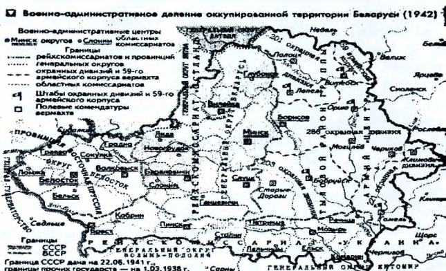
Военно-административное деление оккупированной территории Беларуси 1942г.