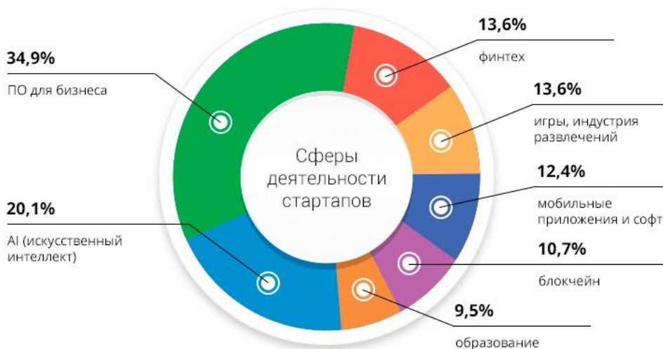
Рис. 1. Стартапы в Республике Беларусь в 2022 году

На рисунке 1 представлена диаграмма со статистикой стартапов в Республике Беларусь в таких отраслях, как искусственный интеллект (20,1%), мобильные приложения и софт (12,4%), ПО для бизнеса (34,9%), образование (9,5%) и другие.