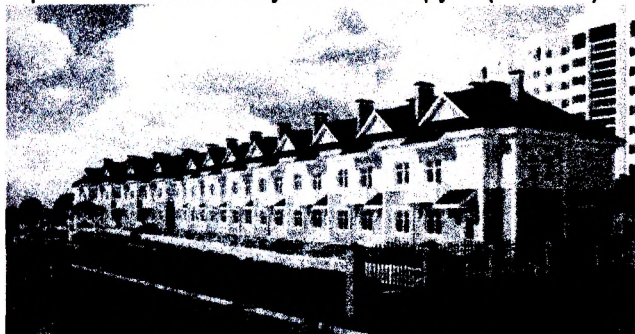
Рисунок 1 – Первый таунхаус в Гомеле

За прошедшие годы белорусы успели оценить прелести таунхаусов и сформировали определенный спрос на такой вид жилья на рынке недвижимости, что сделало таунхаусы перспективным видом строительства в Республике Беларусь (Рис. 3-4).