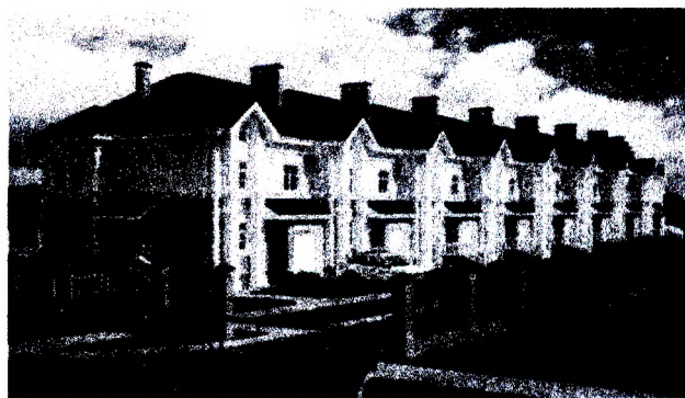
Рисунок 2 – Первый таунхаус в Гомеле