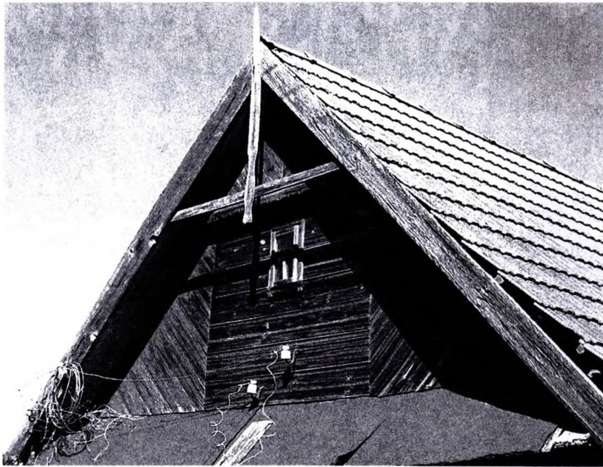
Фото 6 – д. Рогозно