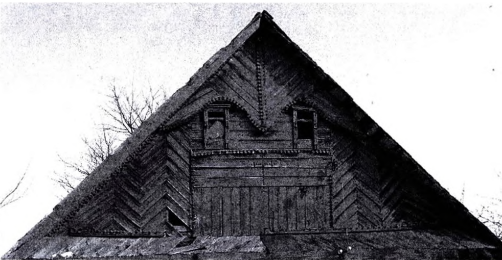
Фото 5 – д. Олешковичи