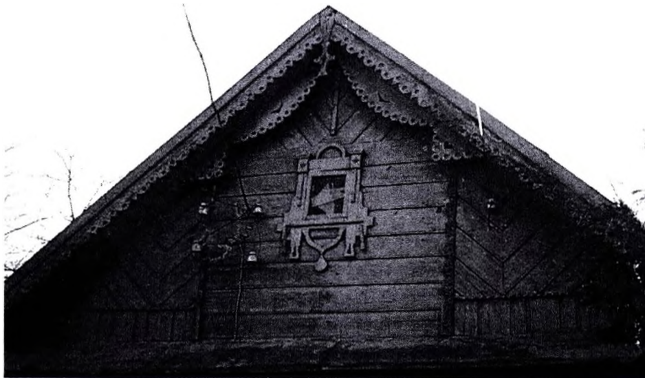
Фото 7 – д. Белево