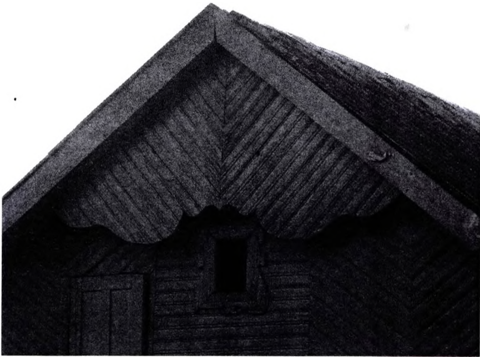
Фото 3 – Предместье Киевка