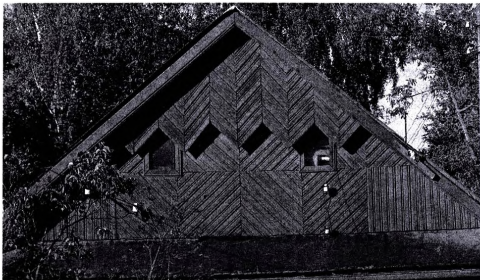
Фото 1 – д. Дубровка