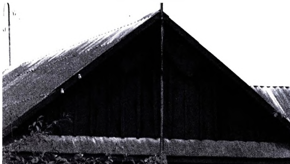
Фото 2 – д. Пугачовка