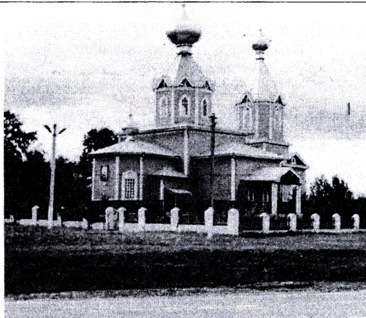
Рисунок 1 – Церковь в агрогородке Крупец Добрушского района

Значительно возросла в современных церквях площадь помещений вспомогательного назначения. Кроме традиционных для старых церквей – жертвенника, ризницы и др., в современных значительное место занимают служебные и технические помещения, размещены в цокольном или подвальном этаже и по общей площади сопоставимые с основной «рабочей» площадью.