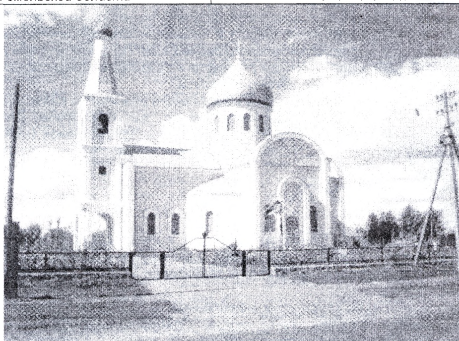
Рисунок 5 – Церковь Пресвятой Богородицы в агрогородке Урицкое Гомельской области

Заключение. Перечисленное нами позволяет показать влияние современных условий на проектирование и строительство зданий, основы формирования которых вырабатывались веками. Вместе с тем в настоящее время после длительного периода забвения проблем культовой архитектуры возрождается интерес к ней и ведется новое строительство.