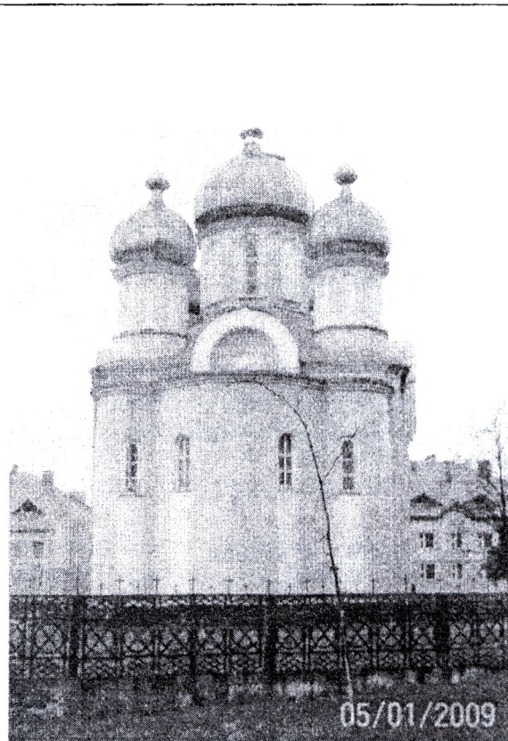
Рисунок 4 – Церковь Успения Пресвятой Богородицы в агрогородке Красное Гомельской области