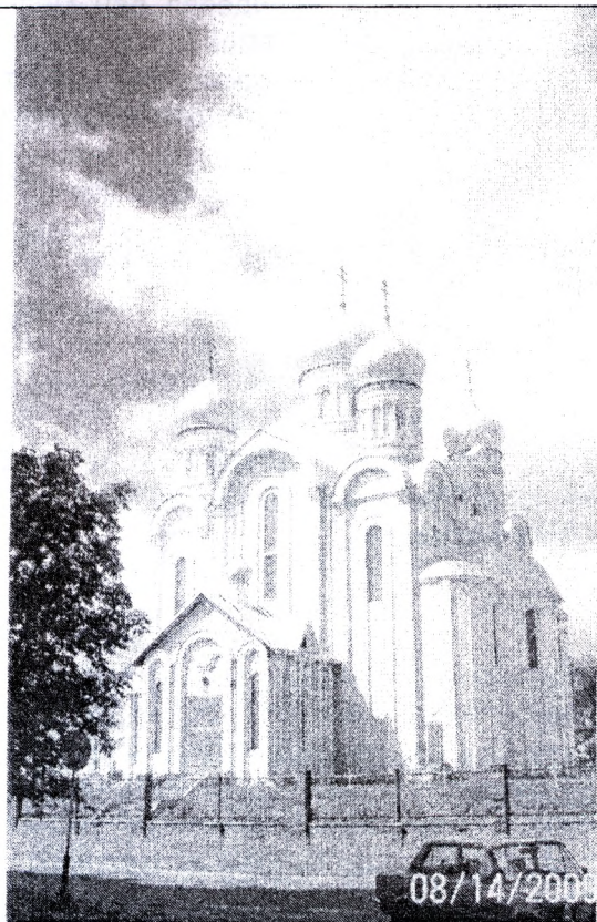
Рисунок 3 – Церковь Преображения Господня в г. Светлогорске Гомельской области