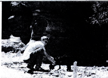
Рисунок 16 – Жизнь продолжается