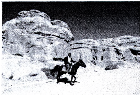
Рисунок 15 – Наследники прошлого