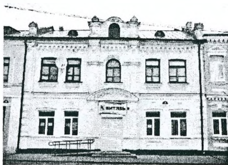
Рисунок 2 - Дом по ул. Советской, 2

Двухэтажные здания отличаются интересной пластикой фасадов, которая создавалась угловыми лопатками, лучковыми, килеподобными арками оконных проемов, профилированными карнизами с аркатурными фризами. В архитектуре использовались орнаментальные качества каменной кладки. Одним из наиболее интересных приемов в формировании пластики фасадов являлись фигурные аттики, завершавшие центральную ось здания над главным входом. Симметрично – осевая композиция фасадов подчеркивалась в центре входными ризалитами, завершенными фигурными аттиками (дома по ул. Ленина, 14, 38, ул. Советской, 2) (рис.2).