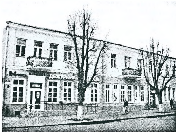
Рисунок 1 - Здание бывшей гостиницы «Париж» по ул. Ленина, 5

В довоенном Пинске процветал гостиничный бизнес. Сохранились здания бывших гостиниц «Париж» (ул. Ленина, 5) (рис. 1), «Варшавская» (ул. Ленина, 31), Басевича (ул. Ленина, 27).