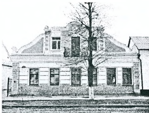
Рисунок 3 - Дом по ул. Советской, 5

Интересными с точки зрения объемного решения являются двухэтажные дома, завершенные фигурными мансардными щитами с балконами в центре (дома по ул. Советской, 5; Ленина, 24). Значительно вытянутые в глубину двора, фасадами выходят на красную линию. Входные группы расположены либо со смещением относительно центральной оси на главном фасаде, либо со стороны дворового фасада. В пластической обработке использованы угловые лопатки, руст, профилированные карнизы (рис.3).