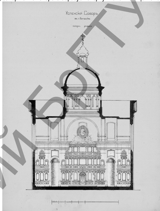
Ил. III. Разрез Успенского собора с иконостасом. Реконструкция автора по данным архивных материалов (1785(?) г.)

(тройная корона папы римского), библия и скрижали заповедей Моисея, «Всевидящее око». Центральным элементом одной из скульптурных групп являлось изображение латинского креста с обвитым вокруг него Змеем. Этот образ восходит к ветхозаветному Медному Змию, который рассматривается как прообраз искупительной жертвы Христа ради исцеления мира. «И как Моисей вознес змию в пустыне, так должно вознесены быть Сыну Человеческому, дабы всякий верующий в Него, не погиб, но имел жизнь вечную» [10]. Среди атрибутов римско-католических священнослужителей имеется кадуцей, завершение которого образует свернувшаяся кольцом змея.