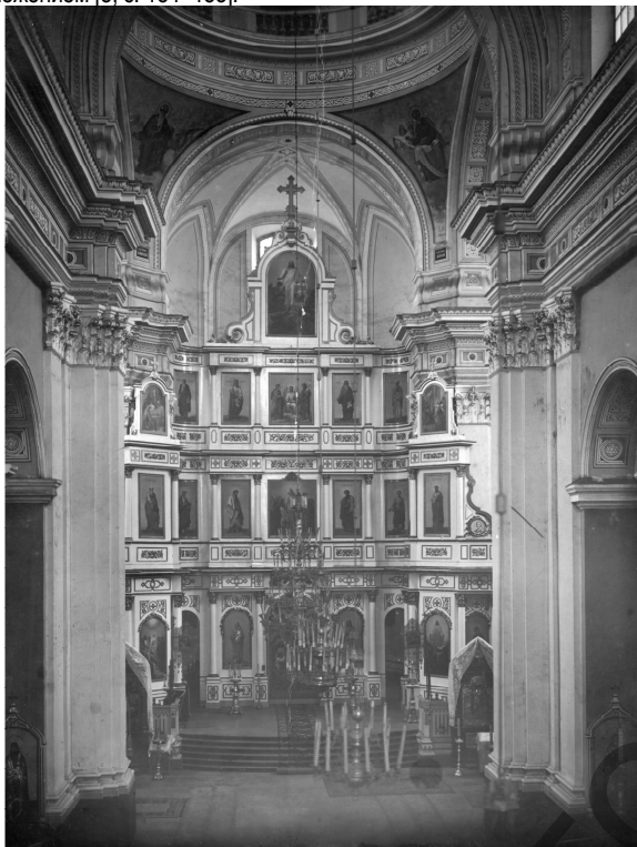
Ил. IV. Фотография иконостаса Успенского собора в г. Витебске. 1913 г.

крученной волкутой. Завершает иконостас резной православный крест. Криволинейные волкуюты располагаются на втором ярусе возле опорных столбов. В глазке волкуюты находятся картуши, на одном из них, с большой долей вероятности, изображен образ Российской императрицы Екатерины II. На сводах появляется роспись с изображением Евангелистов [ил. IV]. Состав икон униатского иконостаса не известен, но, безусловно, первоначальные иконы с региональными особенностями, сложившимися в XVII–XVIII вв. в Витебской иконописной школе, утрачены. И были заменены на новые согласно «Описи икон для иконостасов в каменных и деревянных церквях, предполагаемым к постройке в селениях» с регламентированной формой, размерами, составом и местоположением [8, с. 184–185].