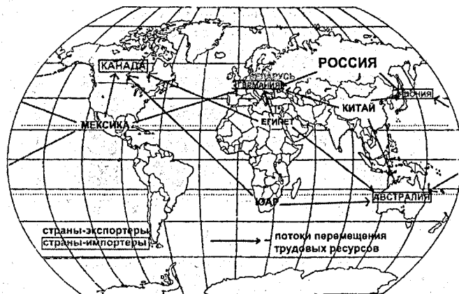
Рисунок 2 – Модель международного рынка труда

На основе выделенных выше особенностей международного рынка труда можно построить новую модель международного рынка труда (рис. 2).