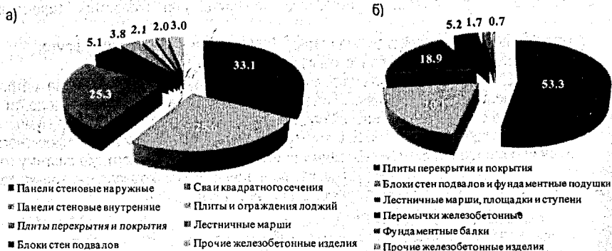
Рисунок 1 – Распределение объемов выпуска готовой продукции (%) для Завода КПД № 2 КУП «Брестжилстрой» [10] (а) и «Завода ЖБК» ОАО «Строительный трест № 8» [12] (б)

Рассмотрим первую стадию реализации проекта, то есть методы учета заводской стоимости на примере сборных бетонных и железобетонных конструкций. На территории Республики Беларусь производятся различные виды бетонных и железобетонных конструкций и изделий. Распределение объемов выпуска готовой продукции для ведущих предприятий-изготовителей Брестской области приведены на рис. 1.