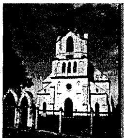
Рисунок 2 – Костел св. Алексея в Сельце

Внешнее и внутреннее великолепие костела поражало современников своей оригинальностью и роскошью. Один паломник из Западной Европы, присутствующий на церемонии освящения храма, не удержался от восторженного отзыва в своих записках: «По своему великолепию нет ничего подобного в нашей рейнской провинции». Монастырь представлял собой сложный архитектурный комплекс, включавший костел св. Иосифа, кельи, трапезную, библиотеку, госпиталь, аптеку и многочисленные хозяйственные постройки; был окружён рвом и каменной стеной с небольшими башенками. Про быт и удивительную предприимчивость монашеской братии можно рассказывать долго. Сегодня остаётся лишь мечтать о том, чтобы восстановить хотя бы одну из частей этого огромного архитектурного ансамбля.