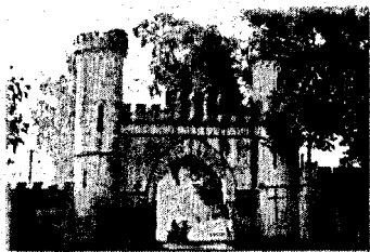
Рисунок 3 – Северная въездная брама в Песках

После величественного образа Картузианского монастыря туристический пейзаж открывается на деревню Соколово, в которой расположена церковь Усекновения главы Иоанна Предтечи. Она построена из дерева в простом, лаконичном стиле в 1820-е годы и обновлена в 1864 г. Совсем недалеко расположена и другая деревня – Пески, через которую пролегает наш маршрут. Она является одним из стародавних поселений на территории Березовщины с 1503 г. Якуб Пусловский выкупил часть земли у Александра Ягелончика, вторую часть его жена Барбара получила в наследство, и к 1939 г. здесь была фамильная резиденция графов Пусловских, которая представляла собой усадебно-парковый ансамбль, состоящий из церкви св. Троицы, северной брамы и здания основной усадьбы. Красоту и неповторимость архитектурных форм запечатлел на своих рисунках Наполеон Орда. Духом романского стиля овеяна въездная брама, построенная