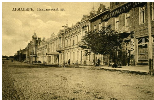
Рисунок 3 – Армавир. Фронтальная застройка исторического квартала. Западная сторона Николаевского проспекта от ул. Бульварной на юг, 1913 г. [3]