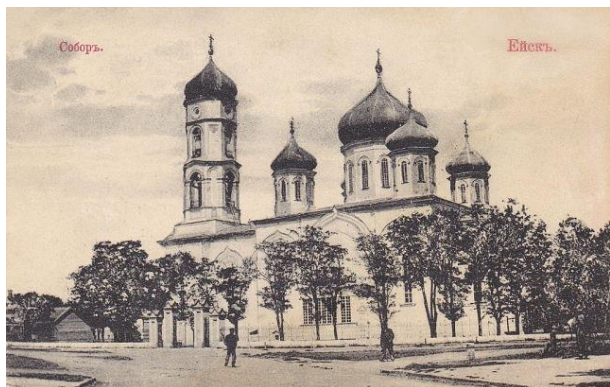
Рисунок 5 – Ейск. Кубанская область Собор Михаила Архангела. Начало XX в. Издатель А. В. Курило. Отпечатано в акционерном обществе «Грандберг» в Стокгольме [10]

В большинстве своем культовые сооружения служили «своеобразным фундаментом» в становлении и формировании исторической среды жизнедеятельности. Они представляли собой уникальные памятники храмового зодчества, в градостроительной композиции им отводилась доминантная роль в исторической планировочной «структуре поселения во взаимосвязи с ландшафтом и природным окружением [9, с. 22]» (рисунок 5).