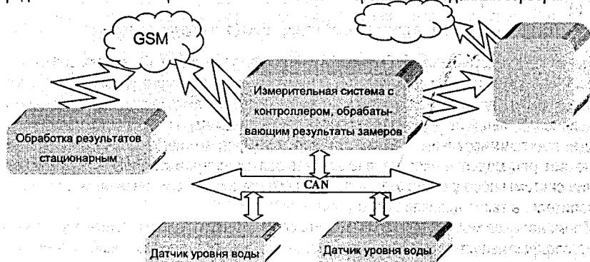
Рисунок 1 – Применение системы для мониторинга паводка

Один из методов частичного решения указанной проблемы – создание единой информационно-вычислительной системы по наблюдению и прогнозированию наводнений, обрабатывающей и интегрирующей потоки данных ручных и автоматизированных измерений с гидропостов, а также мобильных измерительных точек, расположенных в пойме реки. Такая система будет выполнять расчет и визуализацию затопления территорий с учетом движения водных масс на основе данных от контрольных точек мониторинга и статистических сведений, а также нуждается в подсистеме терминального доступа, позволяющей использовать портативные электронные устройства и систему позиционирования GPS для отображения паводковой ситуации и ее прогноза применительно к точке нахождения оператора, либо для автоматизированного ввода результатов изменений с автоматическим определением их геолокации и включением точки измерения в банк данных сервера.