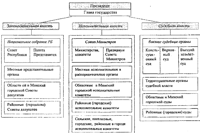
Схема 7.1 – ОРГАНЫ ГОСУДАРСТВЕННОГО УПРАВЛЕНИЯ РБ

Профессиональные союзы, общественные объединения патриотической направленности и их роль в усвоении гражданами содержания идеологии белорусского государства, формировании гражданственности. Общенациональный компонент в содержании идеологии и деятельности политических партий и других общественно-политических объединений. Роль конфессиональных организаций (церкви) в поддержании авторитета идеалов и ценностей белорусского народа, формировании у верующих гражданских качеств, чувства патриотизма. Политика белорусского государства в области этнических и конфессиональных отношений.