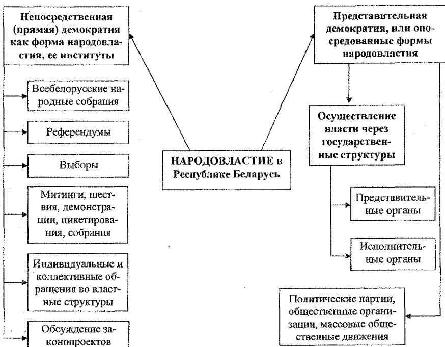
Таблица 4.4 – ПРИНЦИПЫ ПРАВОВОГО ГОСУДАРСТВА

Всеобщность и верховенство права (закона): а) обеспечивается верховенство закона над всеми другими нормативными актами. Их издание возможно только на основе и во исполнение закона. Закон не может быть отменен, изменен или приостановлен никаким ведомственным органом, в т.ч. правительственным; б) закон регламентирует все общественные отношения, нуждающиеся в правовом регулировании, и в равной мере распространен на всех граждан («закон регулирует всех и все»).