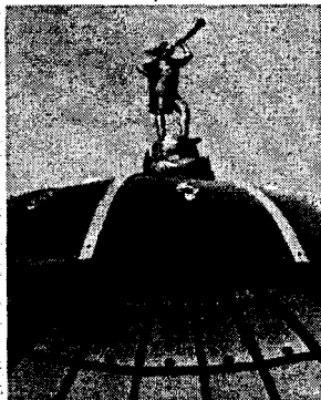
Рисунок 3 – Скульптура «Трубача»

И вот спустя несколько сотен лет, часы и трубач вернулись в город, правда, только в виде скульптурных композиций. Установлены атмосферные часы, верхушка которых представляет собой фрагмент городского герба. Кроме декоративно-утилитарной функции, часы также информируют граждан об эволюции брестской геральдики. А рядом с часами декоративная конструкция в виде купола, украшена скульптурой «Трубача». Композиция высотой 1,8 метра отлита из лёгкого материала – композита и весит около 30 кг, поэтому её способна выдержать достаточно хрупкая конструкция купола.