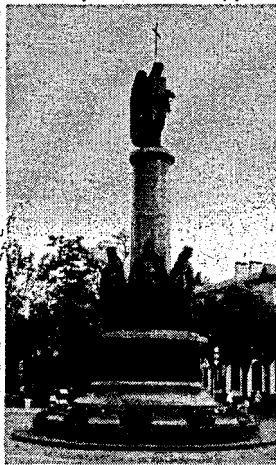
Рисунок 2 – Памятник 1000-летию Бреста

Семь фигур украшают этот монумент. Ангел-хранитель города с крестом (венеч памятника, высота – 3,8 метра) смотрит в сторону старого Берестья. Он защищает город