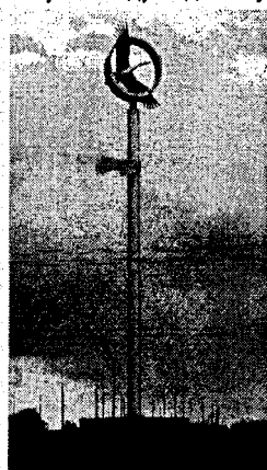
Рисунок 4 – Скульптурная композиция «К солнцу»

На улице Советской «живёт» еще один интересный персонаж – летучая мышь. Она сторожит «Наказ». На свитке написано, что фонарям постановляется гореть всегда и в любую погоду. Идея скульптурной композиции «Старый фонарь» принадлежит брестскому скульптору Алексею Павлючуку, автору монументальной скульптурной композиции, посвящённой 1000-летию основания города.