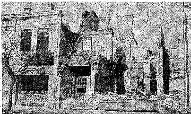
Рисунок 1 – Разрушение города после Первой Мировой войны

Первая Мировая война нанесла значительный ущерб белорусским городам и местечкам. При отступлении русских войск в 1915 году было принято решение об эвакуации населения вглубь страны и уничтожении всех оставляемых ценностей (жилой фонд, коммуникации). В Брест-Литовске было разрушено 75 % зданий. Немецкие власти не стали отстраивать Брест, превратив его в «складской» город.