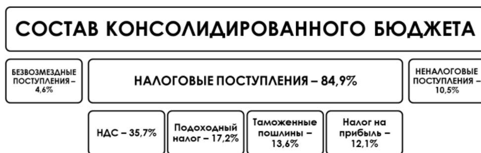
Рисунок 1 – Структура и состав консолидированного бюджета Республики Беларусь, 2019 г.

30 % [1]. В структуре именно налоговых поступлений, налог на прибыль предприятий является четвертым по величине (12,1 %, 2019 г.).