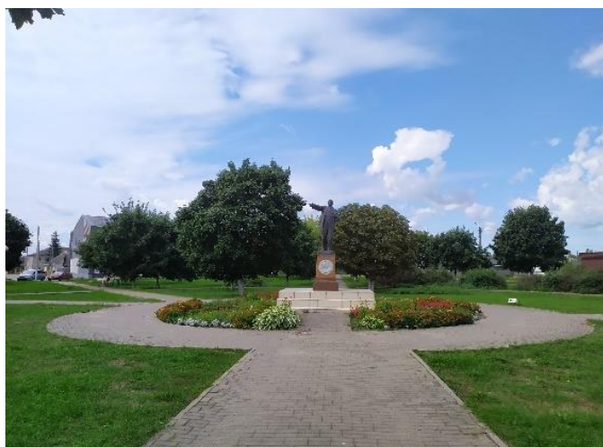
Рисунок 1 – Площадь Ленина в Столбцах

К сожалению, в годы Великой Отечественной войны города Беларуси были значительно разрушены и при дальнейшем восстановлении создавались практически новые городские центры и площади. Политические тенденции советского времени требовали создания в городах пространств для массовых мероприятий, демонстраций, что и было реализовано во многих городах. Поэтому в настоящее время в центрах городов мы видим площади больших размеров (Давид Городок, Клецк, Хойники). Некоторые города с богатой историей, насчитывающей шестьсот – тысячу лет, сегодня в центре имеют площадь (Ленина, Свободы) с соответствующей планировкой, застройкой и благоустройством (Столин, Дрогичин, Хойники). Площади имеют элементарный план (четырёхугольные в плане), формируются 2–4-этажной застройкой с доминирующим главным административным зданием. Часто центром композиции таких пространств является памятник В. И. Ленину (Рисунки 1, 2). В некоторых городах площадь имеет в центре сквер или бульвар, что создает более комфортные условия для пребывания людей (Ивье, Столбцы, Воложин, Островец, Клецк, Заславль). На некоторых площадях в центре расположены здания (Иваново, Заславль, Несвиж). На главных городских площадях были созданы мемориальные зоны (Городок, Ивье). При таком разнообразии формирования площадей практически все они окружены улицами с активным движением транспорта.