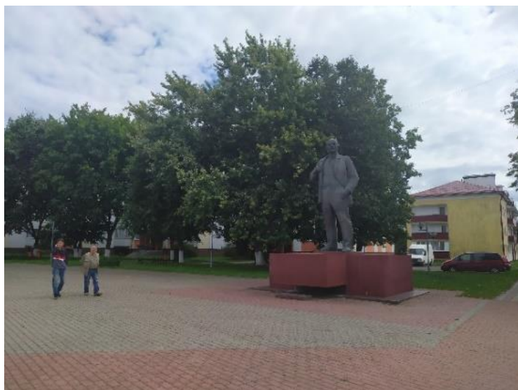
Рисунок 10 – Памятник Ленина на площади Ленина в Дрогичине