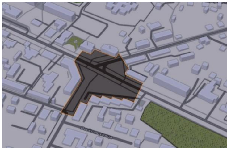
Рисунок 8 – Выделение пространства площади Ленина в Дрогичине на основе сайта demo.f4map