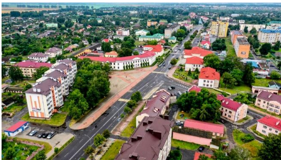
Рисунок 9 –Площадь Ленина в Дрогичине [5]