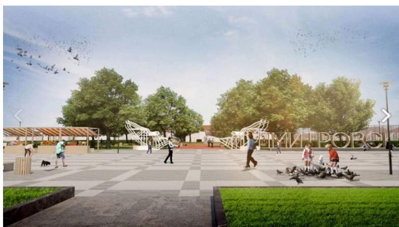
Рисунок 18 – Проект для города Дмитровска [8]

Хотелось бы, чтобы и для городов Беларуси создавались новые интересные пространства, дружелюбные для людей. На городских пространствах могут появиться новые функции: уличные лектории, спортивные площадки, обзорные башни, площадки для аттракционов и т. д. Это позволит создать мультифункциональные пространства для жителей и для повышения туристической привлекательности городов Беларуси.