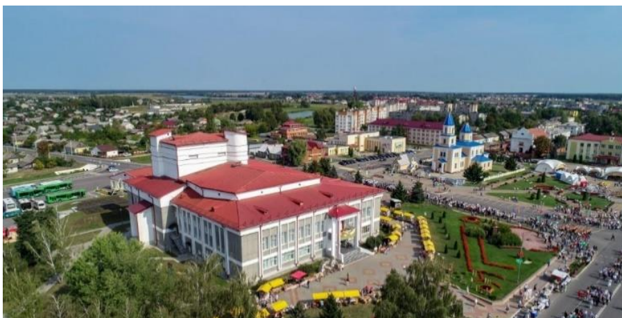
Рисунок 14 – Пространство Иванова в праздничный день [6]

Проанализировав некоторые городские площади малых городов Беларуси, можно сделать вывод, что площади в основном сохраняют наследие советской эпохи, имея большую историю до этого периода. Площади, сформированные в послевоенное время, имеют схожие