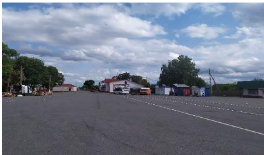
Рисунок 6 – Площадь Красная и автостанция в Турове

Дрогичин (первое упоминание в 1452 году) имеет население 14 963 человека [1]. Центром города XVIII века были две прямоугольные площади (рис. 7). В центре одной из них находились торговые ряды и деревянная ратуша. Площади были нанизаны на одну улицу и практически имели одну общую точку. Со временем площади меняли свой характер. На сегодняшний день на месте торговой площади частично сохранилось открытое пространство, но получило другое функциональное использование и соответственно архитектурное оформление (дом культуры, собор, общественные здания). Доминирующий объем дома культуры формирует пространство перед ним – аванплощадь. С другой стороны площади за улицей К. Марска заканчивается возведение храма Ефросиньи Полоцкой. В этой части площади будет главенствовать храм, что и определит ее характер. Пространство второй площади застроено магазинами, кафе и другими объектами. Далее, по улице Ленина создана площадь Ленина, имеющая сложный для восприятия план, но в то же время получилось динамичное пространство (рис. 8, 9). Пространство разрезано улицей Ленина, с северной стороны прикрывает улица 17 Сентября и стоянка, с южной – небольшой бульвар улицы Советской. С южной стороны треугольное в плане пространство, обрамленное зданием райисполкома и жилым домом. Перед жилым домом небольшое озелененное пространство, ближе к жилой застройке установлен памятник Ленину (рис. 10). Здание райисполкома, памятник Ленину