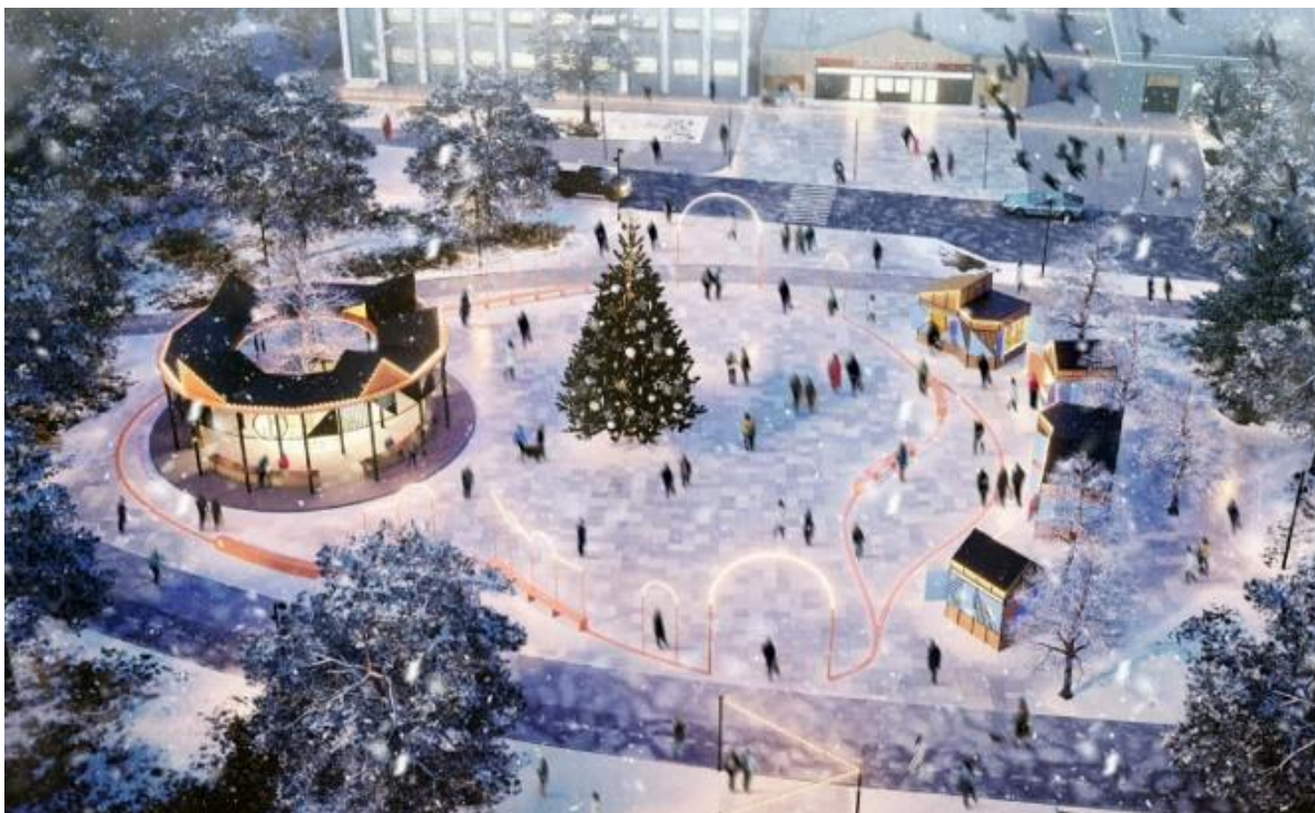
Рисунок 15 – Проект для города Фурманова [8]

По проекту города Агидели предусмотрено создание нового центрального общественного пространства «Волны Агидели» на месте участков школы и детского сада (рис. 16). «Новый общественно-культурный центра города – шаг к реализации стратегии города в парке, экологически чистого, уютного, компактного, комфортного для жизни и привлекательного для инвестиций» [8]. Для города Глазова проектом было предусмотрено создание современной пешеходной зоны (рис. 17), «где могут развиваться различные городские сервисы» [8]. Для города Димитровска выполнен был проект «Голубь Кантемира» (рис. 18), названный в честь основателя города Дмитрия Кантемира. Проектом предусмотрено «объединение трех ключевых городских территорий в единое общественное пространство, которое способно быстро менять свою структуру в зависимости от задач и сценариев использования. Двигателем развития нового пространства станет ежегодный фестиваль декоративных птиц» [8].