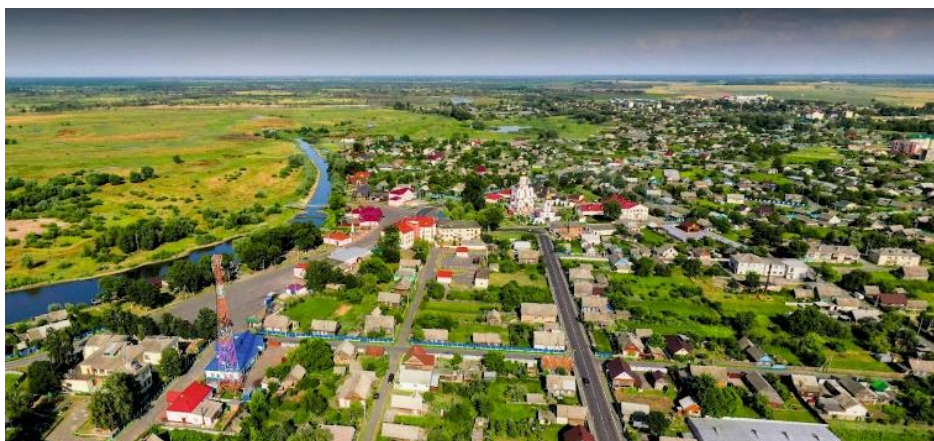
Рисунок 4 – Фото Турова [3]