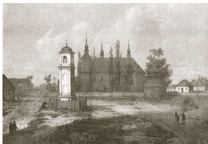
Рисунок 11 – Литография Максимилиана Фаянса (с рисунка Наполеона Орды)