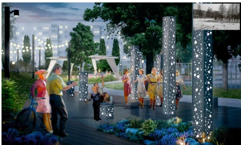
Рисунок 16 – Проект общественного пространства Агидели [8]