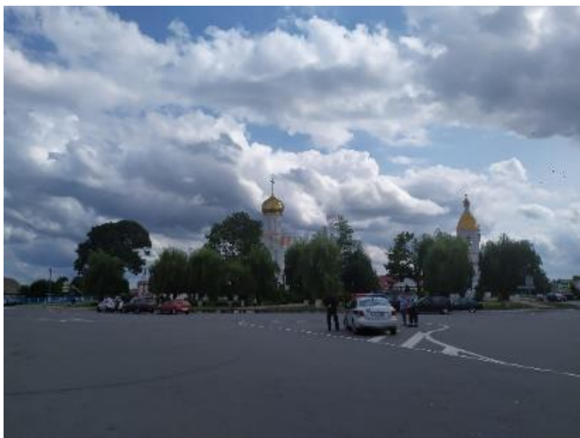
Рисунок 5 – Площадь Октябрьская в Турове