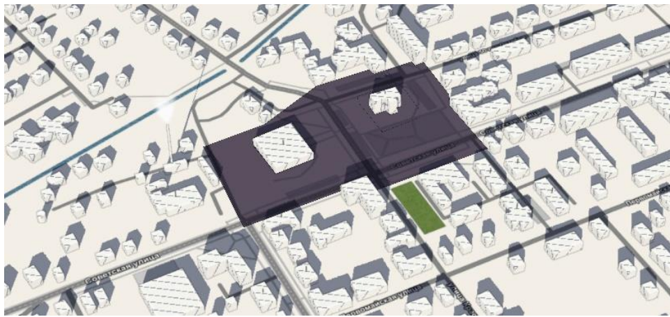
Рисунок 12 – Выделение пространства площади Иванова на основе сайта demo.f4map