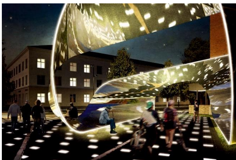
Рисунок 17 – Проект для города Глазова [8]