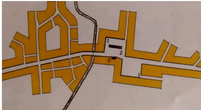
Рисунок 7 – План Дрогичина середины XIX века: 1 – торговые площади, 2 – ратуша и торговые ряды [4, с. 55]

все время воспринимаются контражуром, здания с другой стороны улицы имеют административное назначение. Площадь сформирована как перекресток улиц, имеет современное мощение, но не выглядит современным городским пространством.