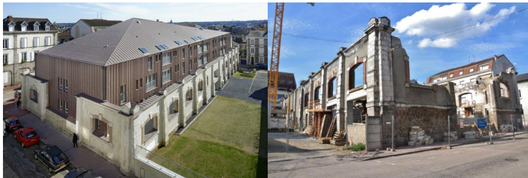
Рисунок 3 – Жилое здание до реконструкции и после

От первоначального здания остались только стены, которые превратились в руины в центре города. Архитектурным бюро Aedificare был разработан проект, согласно которому не потребовалось восстанавливать здание. Такое решение оказалось весьма экономичным и практичным для жилья. Здание не требовало декора, а современная облицованная цинком постройка подчеркивает особенности архитектуры исторического здания, а также сочетается с окружающей городской средой (рис. 3).