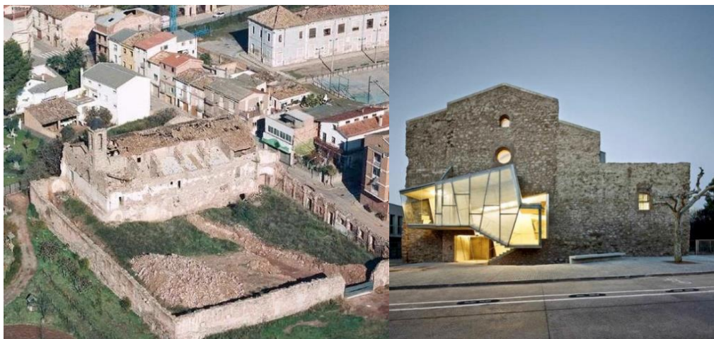
Рисунок 4 – Бывший женский монастырь до реставрации и после

4. Для того чтобы воссоздать памятник и его историческую среду, необходим тщательный анализ: исследование исторических фотографий и планов поселения, хронологии событий, типологии архитектуры, местной стилистики и традиций. Все это поможет воссоздать уникальный (первоначальный) исторический и архитектурный облик местности.