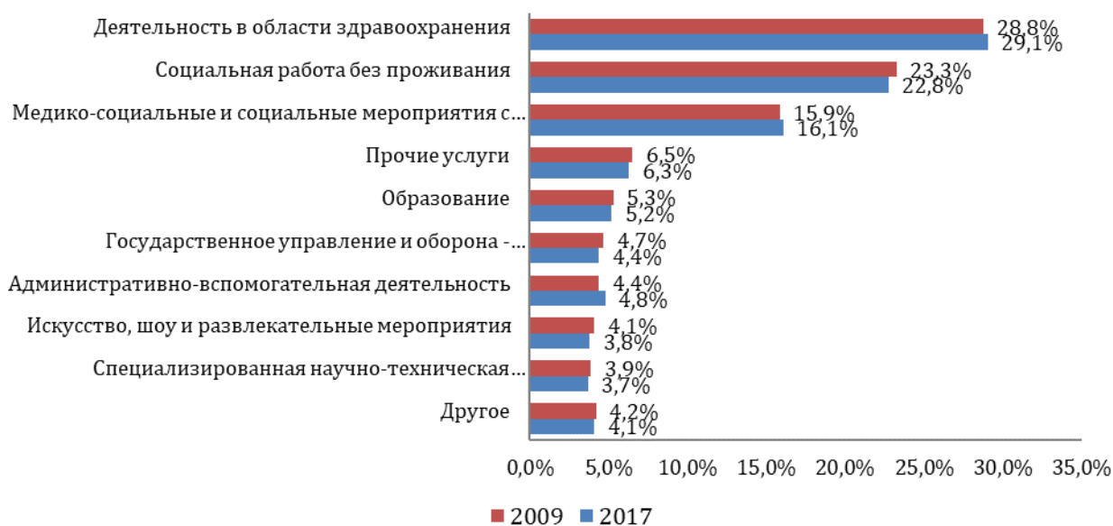
исунок 1 – Распределение наемной занятости (ЭПЗ) социальных предприятий в Бельгии по секторам в 2009 и 2017 годах [5]

Социальные предприятия работают во многих секторах бельгийской экономики: образование, здравоохранение, торговля, социальная защита, туризм, банковская сфера, сельское хозяйство, страхование. Социальные предприятия, осуществляя определенный вид деятельности, обеспечивают экономику рабочими местами, в том числе трудоустривая граждан, которым необходима социальная поддержка. Несмотря на большое разнообразие секторов деятельности, в которых присутствуют социальные предприятия, сферы здравоохранения и социального обеспечения являются доминирующими с точки зрения оплачиваемой занятости. Предприятия, деятельность которых связана со здравоохранением (29,1 % рабочих мест), социальной работой без проживания (23,3 %) и медико-социальными и социальными мероприятиями с проживанием (15,9 %) вместе составляют более двух третей рабочих мест в социальных предприятиях. Важно, что распределение рабочих мест в 2017 году было близко к значениям 2009 г., что свидетельствует о стабильности.