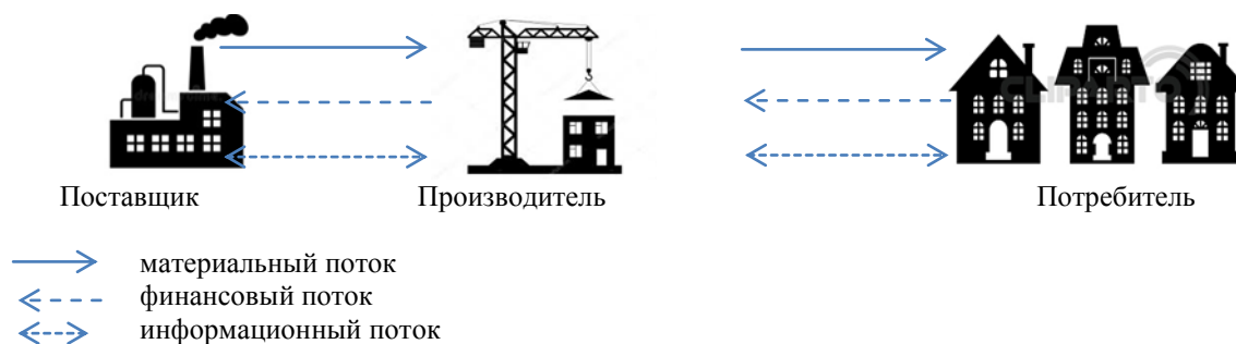
Рисунок 2 – Ключевые звенья цепи в сфере строительства

Производители – это звенья, которые могут производить как полуфабрикаты, так и готовую продукцию с точки зрения потребителя. Дистрибьюторы (посредники) – это организации, целью которых является не изменение физической формы продукта, а разделение больших и однородных потоков продуктов на более мелкие и более широкие с точки зрения доступности продукта. Эти организации также стремятся внимательно отслеживать и анализировать предпочтения и спрос клиентов, которым они продают товары. Они также проводят прямую рекламу, часто используя ценовые скидки, выбирая продукты и предоставляя услуги, обеспечивая комфорт покупателя таким образом, чтобы привлечь его внимание к продаваемым ими продуктам. Клиенты или потребители – это любые организации, покупающие или использующие продукты (рис.2).