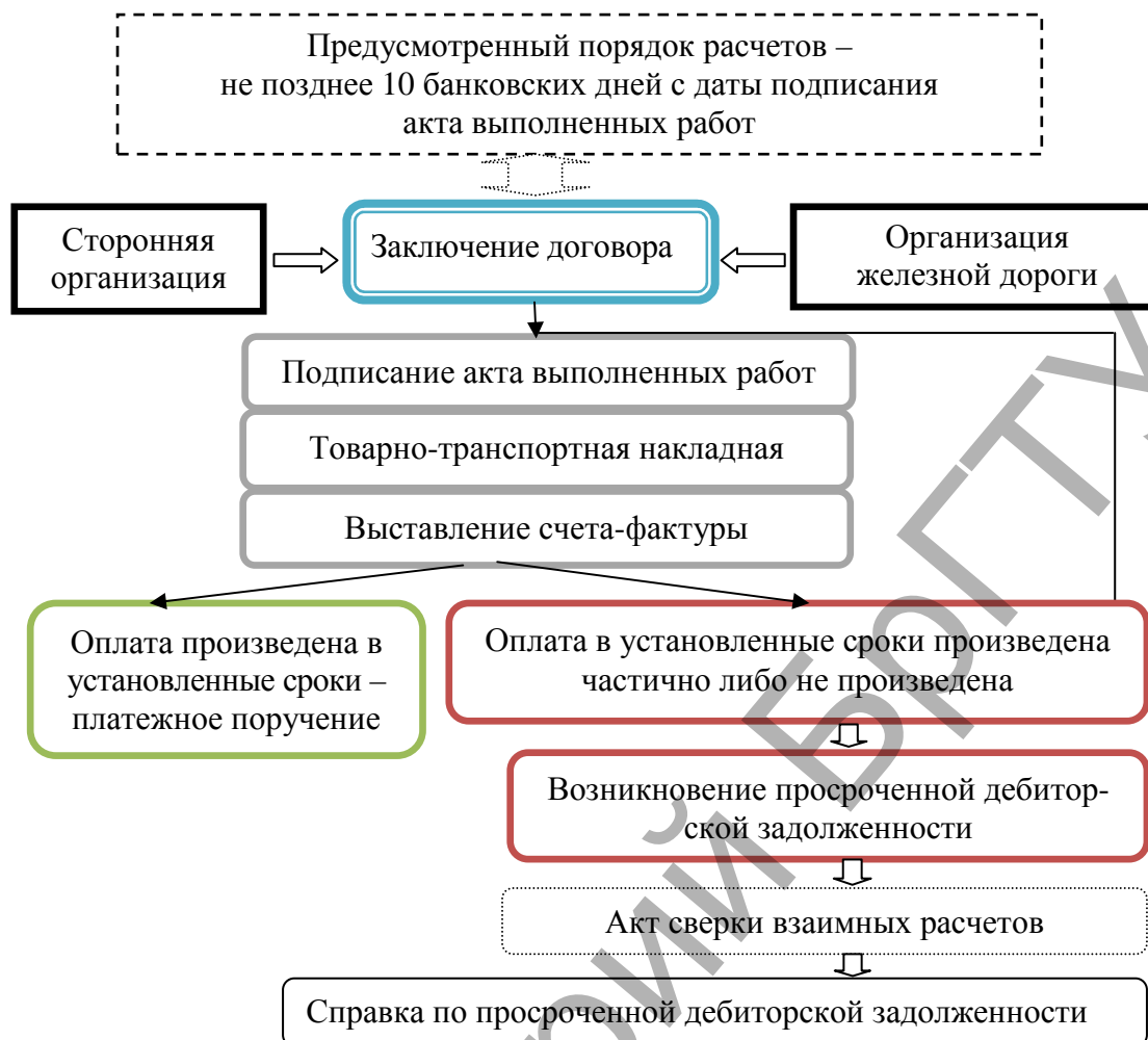
Рисунок 2 – Схема формирования информации по просроченной дебиторской задолженности

Необходимо осуществить проверку соответствия заключенного договора и счета-фактуры по датам и суммам. Форма таблицы для представления информации с целью проведения контрольных процедур представлена в таблице 1.