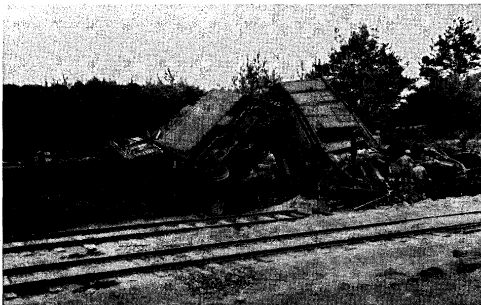
Взорванный партизанами немецкий эшелон. 1943 год