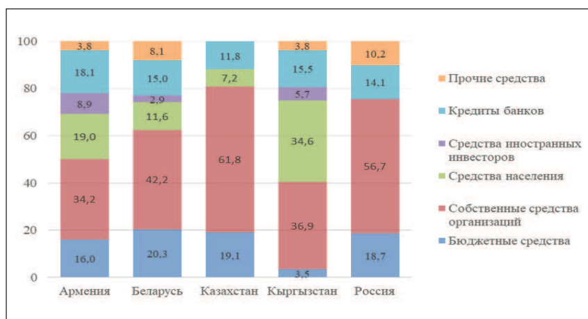
Рисунок 3. – Структура инвестиций в основной капитал предприятий Армении, Казахстана, Кыргызстана, России по источникам финансирования (2020 г.), % [3]

2020 г. Субъекты предпринимательства этих стран активно взаимодействуют в различных экономических сферах.