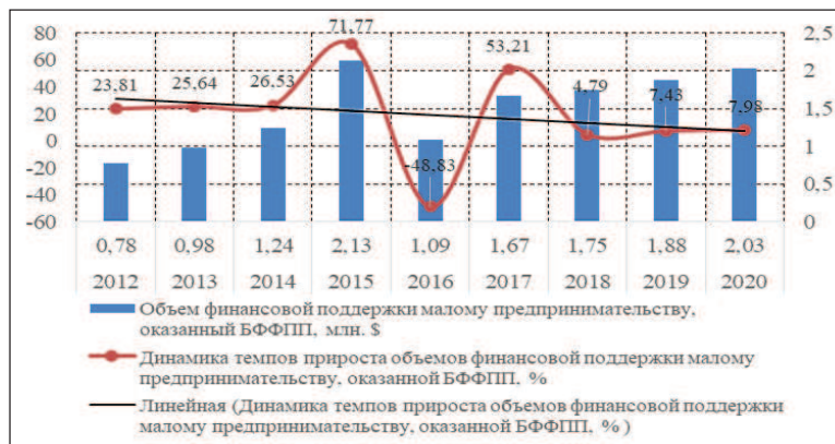
Рисунок 2. – Динамика объемов финансовой поддержки субъектов малого предпринимательства, оказанная БФФПП (2012–2020 гг.) [1]

По показателям, приведенным на рисунке 2, объемы оказанной финансовой поддержки субъектов малого предпринимательства с 2012 по 2020 гг. варьировали в пределах 0,78–2,13 млн долл. США. Наибольший объем финансовой поддержки наблюдался в 2015 г., далее происходит падение объемов финансирования. А с 2017 по 2020 г., согласно рисунку 2, отмечается постепенный рост объемов финансирования. Значение показателя отражает объем средств, выделенных в рамках программ государственной поддержки малого и среднего предпринимательства и соответствующих потребностям субъектов предпринимательства. На этот показатель влияет и социальная значимость предприятия, которое обратилось за поддержкой, а также отсутствие у него убытков.