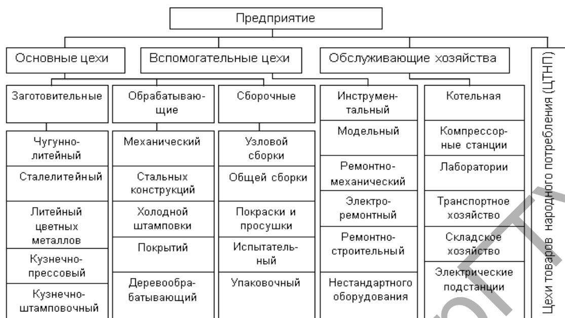
Рисунок 2 – Производственная структура машиностроительного предприятия