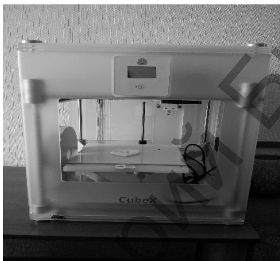
Рисунок 1 – Внешний вид принтера CubeX

Последовательность изготовления логотипа ФКП следующая. На первом этапе изготовления логотипа была сгенерирована 3D-модель в программе AutoCAD (рисунок 2). При этом потребовалось конвертировать эту модель в нужное расширение, так как принтер распознает только формат .cubex. На втором этапе через порт USB и путем нескольких манипуляций с тачпадом был запущен процесс печатания. Спустя четыре с половиной часа логотип был воссоздан (рисунок 3).