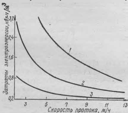
Рис. 3. Зависимость расхода электроэнергии на очистку 1 м 3 хромосодержащих стоков от скорости протока при плотности тока: 1 — 5,0 а/дм 2 ; 2 — 2,5; 3 — 1,25 а/дм 2

чения необходимого количества коагулянта. В связи с этим был установлен автоматический переполюсатор пластин с интервалом действия 15 мин и изготовлен пакет электродов с зазором между