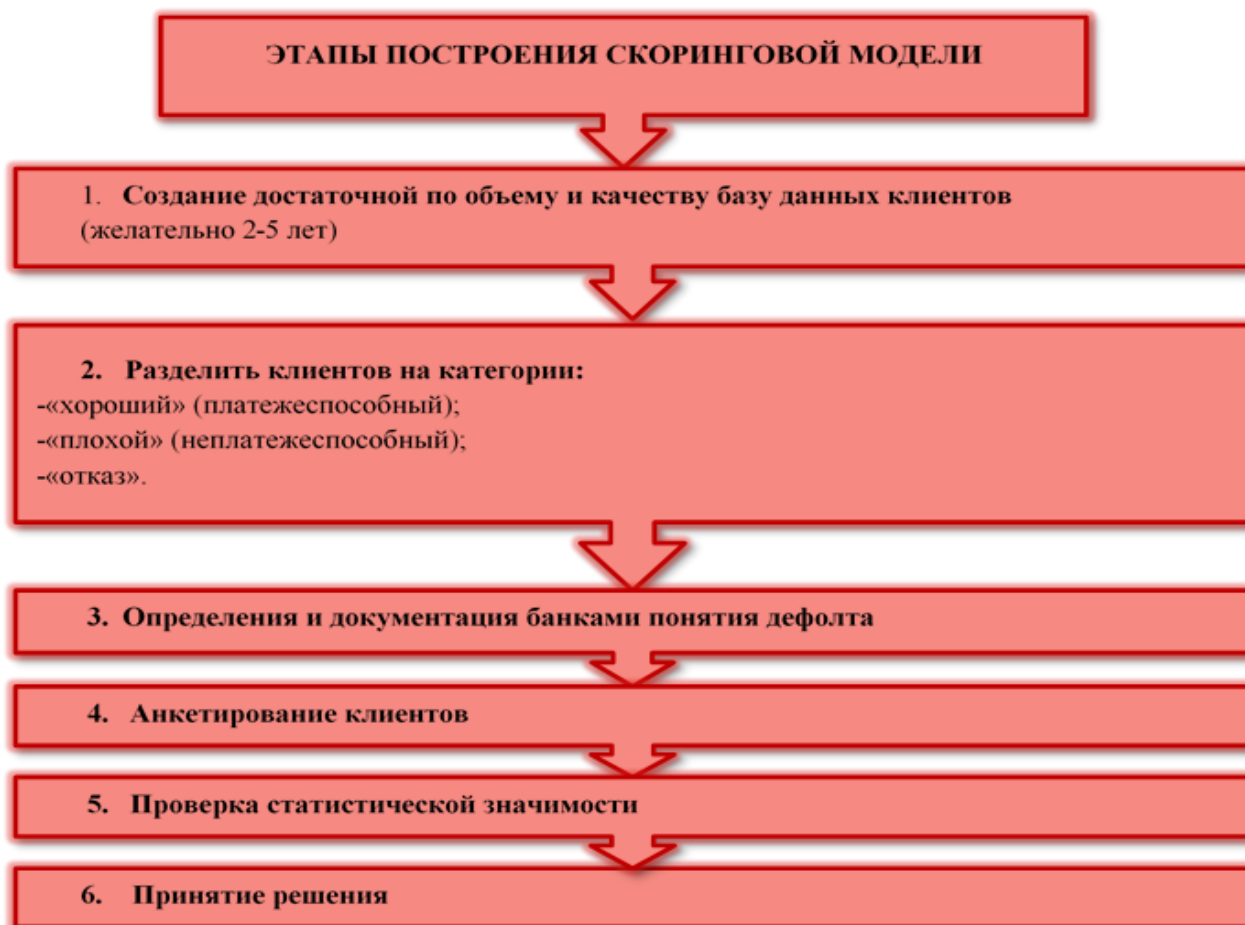
Рисунок 1 – Этапы построения скоринговой модели

Рассмотрим этапы построения скоринговой модели (рис. 1).