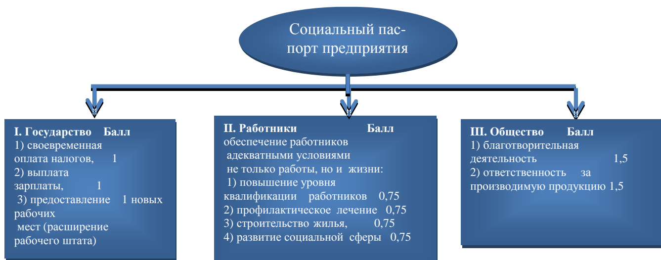
Рисунок 2.1 – Структура социального паспорта предприятия.

Суть методики определения уровня социального развития предприятия заключается в следующем. Предприятие оценивается по каждому из трёх аспектов (взаимодействие с государством, работниками и обществом в целом) в баллах. Максимальный балл по каждому аспекту-3, минимальный-0. Внутри каждого аспекта существуют подпункты, максимальный балл по которым зависит от выбранного аспекта. Например, в аспекте “государство” существует 3 подпункта, максимально возможные баллы по которым определяются как максимальный балл за весь аспект, деленный на количество подпунктов в аспекте. После оценки подпунктов баллы по ним внутри аспектов суммируются и вычисляется балл каждого аспекта.