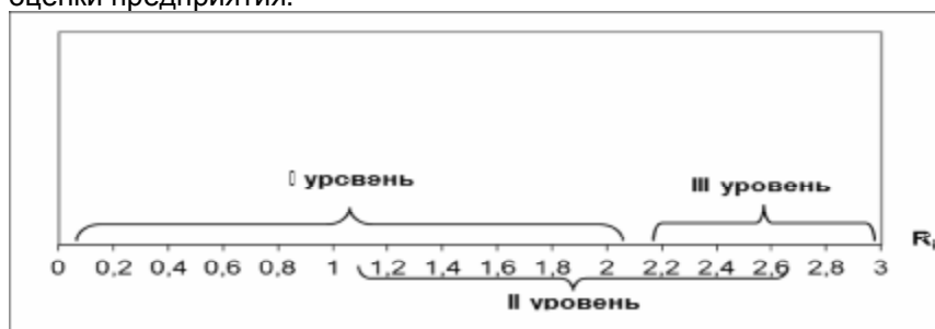
Рисунок 2.5 – Шкала оценки социального уровня предприятия.

Исходя из рассчитанных рейтингов и построенных матриц с вариантами баллов, можно построить шкалу рейтинговой оценки предприятия.