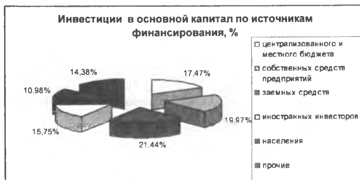
Рисунок 2 – Инвестиции в основной капитал по источникам финансирования, %

Проанализировав диаграмму можно отметить, что в целом объем инвестиций в основной капитал имеет тенденцию к увеличению. В основном инвестиционная деятельность осуществляется за счет собственных средств предприятий, за счет заемных средств и средств бюджета.