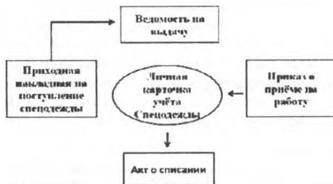
Рисунок 1 – Схема документооборота учета спецодежды

Документооборот, сопровождающий учет спецодежды, представлен на рисунке 1.