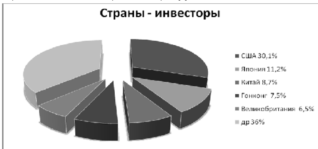
Рисунок 1 – Рейтинг крупнейших стран инвесторов [4].

Инвесторы из развитых стран на фоне продолжающегося кризиса еврозоны неохотно вкладывают свои средства в большинство европейских стран. [4]