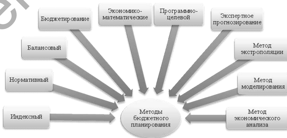
Рисунок 1 – Методы бюджетного планирования

Реальность бюджетных показателей во многом зависит от использования различных методов бюджетного планирования, от возможности их сочетания с учетом специфики каждого. Наиболее распространенные методы бюджетного планирования представлены на рисунке 1.