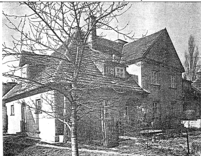
Рис. 1. Чиновничий Жолибож. Застройка улицы Бродинского, дом № 8. Арх. А.Боемский, 1923г.

Дома №3,11. Одноэтажное мансардное здание. Объемно-пространственная композиция основана на контрасте приземистого этажа и высокой скатной крыши, покрытой черепицей. Боковые усадьбы и фигурный аттик мезонина, выходящего на главный фасад, декорированы лопатками и сандриками. На первом этаже – трехкомнатная квартира, в мансарде – двухкомнатная. Отдельные входы в квартиры размещены в нишах, образованных двумя арками с угловой опорой [6].