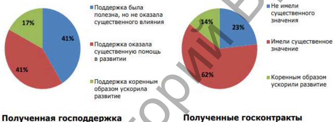
Рисунок 3 – Результаты ответов на вопрос: «В какой мере была важна господдержка для развития компании?» (график слева) и «В какой степени были значительны госконтракты, выполненные за последние 3 года, для развития компании?» (график справа) [1, с.41]

Также «Тех-Успехом» проводился опрос, целью которого было выявить различия оценок компаний, получавших господдержку и госконтракты, сделать выводы об эффективности госконтрактов.