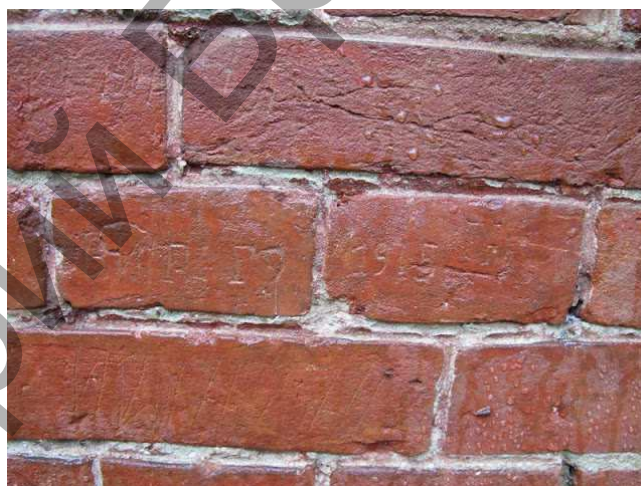
Рис. 2. Надпись на стене каземата защитников крепости в 1915 г.

С 1921 по 1939 год на Западном острове, названном в память о русских воздухоплателях Авиационным (один из аргументов в пользу размещения здесь эллингов), располагались дома военных (в основном сапёров). Остров пересекала дорога от Тереспольских ворот до проезда через оборонительные валы, ведущая к Тересполью и к шоссе на Варшаву. В 1938 году здесь планировалось создать главную базу военной речной флотилии.