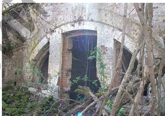
Рис. 4. Современное состояние фортификационных сооружений

Транспортная доступность оценивается по отношению к местам наибольшей концентрации туристов – трассы международного и национального значения и города с численностью населения более 100 тысяч. Территория Тереспольского укрепления расположена в городе Бресте – потенциальном центре туризма национального значения и в непосредственной близости от транспортно-коммуникационного коридора Е30. Положительным фактором при анализе транспортной доступности для иностранных туристов является близость к изучаемой территории международного пограничного перехода «Варшавский мост». Таким образом, транспортную доступность Тереспольского укрепления можно оценить как очень хорошую.