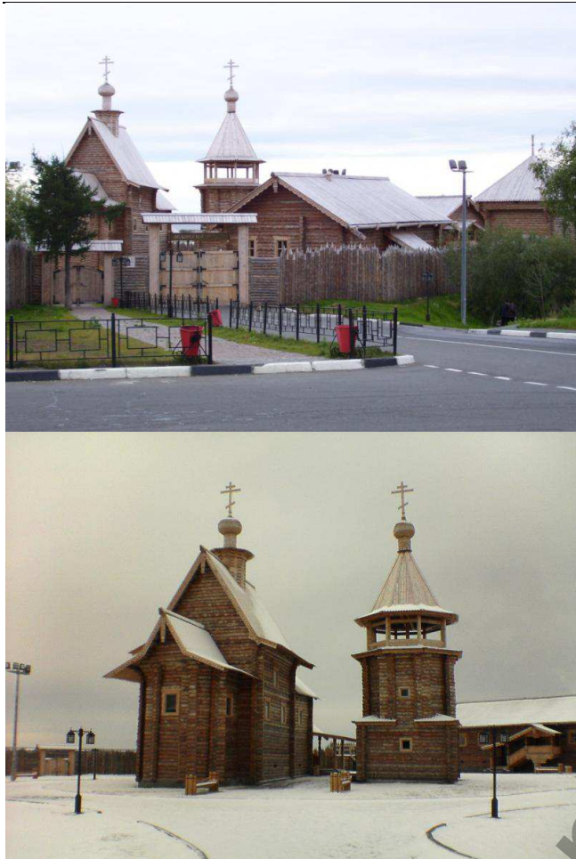
Рис. 5. Крепость в Обдорске

Воссоздание одного сооружения возможно, но для создания целостного восприятия лучше, когда возрождается весь ансамбль. Во втором случае не допустима стилизация других построек, не являющихся древними сооружениями под исторические здания, так как это разрушает единый композиционный строй и художественный образ. В ходе предлагаемого воссоздания предполагается возродить не только одну башню, но и часть крепостных стен. Возможно воссоздание городского укрепления. Оно имело два типа защиты, рвы с водными рубежами и городни, представляющие собой ряд отдельных срубов, пристроенных друг к другу. На городнях можно воссоздать так называемые «бычки» – прирубы для постановки орудий.