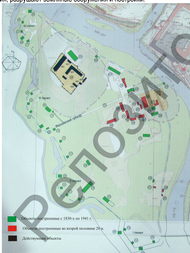
Рис. 3. Схема сооружений Пограничного острова ОАО «Брестреставрация»

Современное состояние. Сегодня остров закрыт для посетителей. Данная территория, в отличие от всей крепости, не включена в Список историко-культурного наследия Республики Беларусь. На его территории сохранилось много сооружений, нетронутых в послевоенные годы, когда царские кирпичи использовали для строительства домов. Пользуясь данными ОАО «Брестреставрация» (рис. 3) и результатами наблюдений (рис. 4), можно оценить степень сохранности сооружений Тереспольского укрепления как хорошую (50–75%). Территория сильно заросла деревьями и кустарником, которые нарушают восприятие укрепления как фортификационного сооружения, разрушают земляные сооружения и постройки.