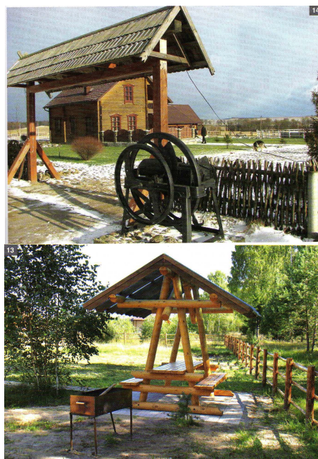
1 – въездные ворота; 2 – площадка для барбекю