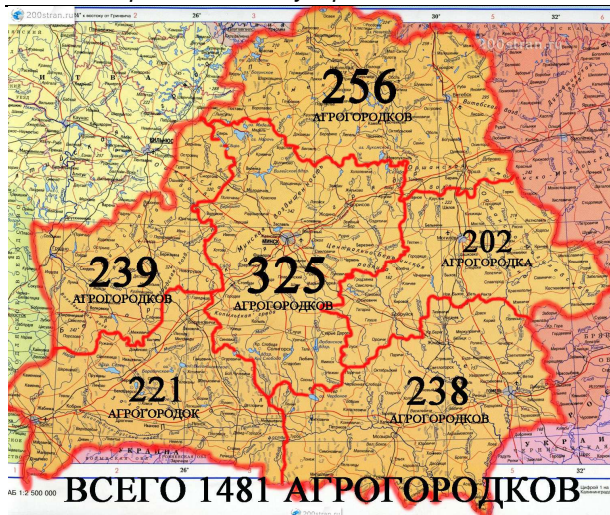
Рис. 1. Распределение агрогородков на территории РБ

Создание агрогородков основывалось на определённых факторах, где главными являлись наличие исторически развитого административного центра и устоявшегося доходного промышленного производства. Такие села отличались более высокой численностью населения, а также концентрацией в них объектов социальной и производственной инфраструктуры.