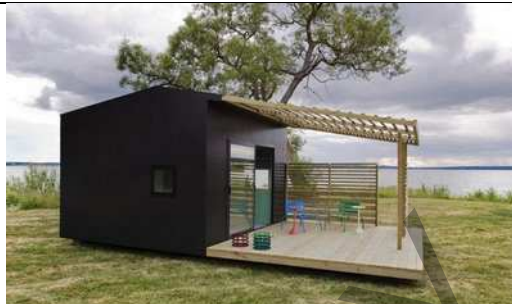
Рис. 5. Примеры различных проектов префаб-домов