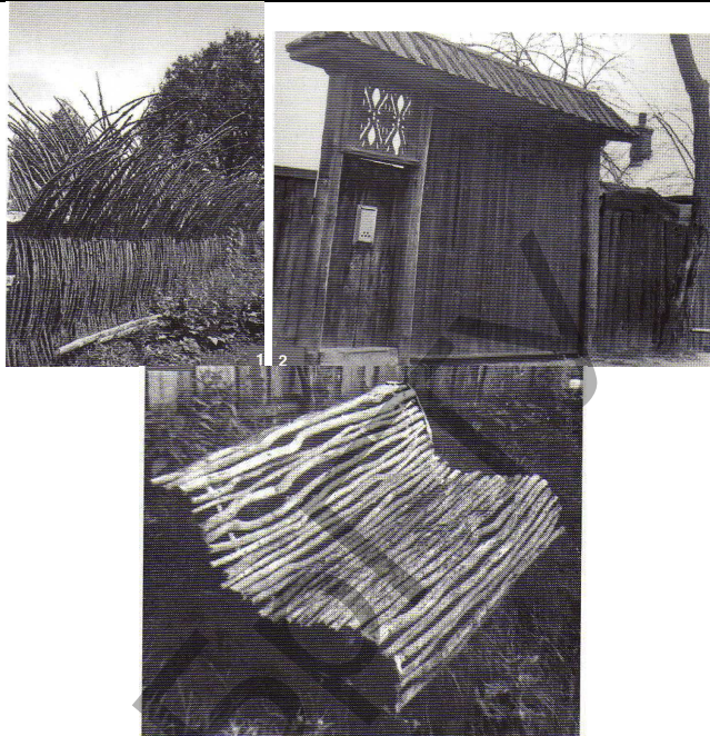
1 – ограждение; 2 – ограждение с воротами; 3 – скамья