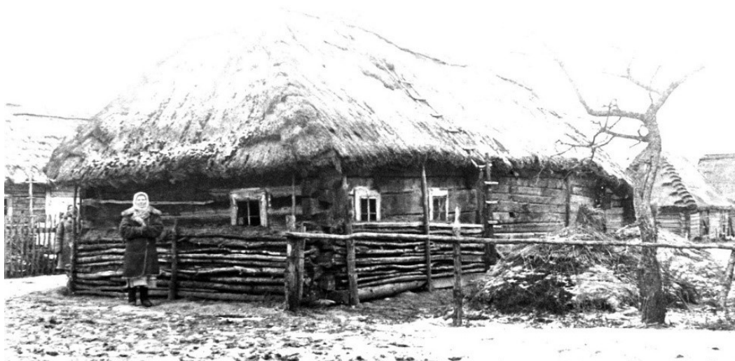
Рисунок 1 – Жилой дом в Вишевичах Пинского района. Фото Д. Георгиевского. 1937 г. (Музей Белорусского Полесья. ПОМ. № 2374)

Произошло это потому, что более теплые климатические условия этого историко-этнографического региона Беларуси повлияли на архитектурные формы, конструктивные решения и технологии строительства. На Западном Полесье получило распространение строительство из «дылей» – расколотых вдоль бревен на две-четыре части [1, с. 32; 17, с. 25]. Такой элемент становился тоньше цельного бревна, но тем не менее, поскольку отрицательные температуры не были слишком критичными, такой дом оставался достаточно теплым и обеспечивал нормальные условия для проживания и в зимний период. Конечно, при этом к зиме дом дополнительно готовили: утепляли проемы; снаружи вдоль стен до низа окон устраивали дополнительную стеночку из жердей – «прызбу», с засыпкой мякиной или опилками; заготавливали необходимое количество дров и т. д. (рис. 1). К тому же такое разделение ствола на части позволяло из одного ствола дерева получить несколько конструктивных элементов для сруба, а строительство в целом получалось более экономным, так как строевой лес всегда стоил немало.