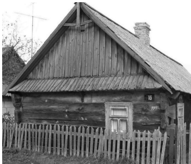
Рисунок 5 – Жилой дом в д. Октябрь Кобринского района. Сруб из четырех венцов. 2005 г

Строители всегда стремились к унификации строительных элементов, поэтому планы жилых домов, основанные на квадратах или близких к ним прямоугольниках, а также на единой, общепринятой системе мер, позволяли закладывать основу цельности построек, органичного вхождения новых строений в существующую застройку. Важным, решаемым в процессе строительства вопросом оставалось нахождение оптимальных соотношений сооружения и его частей (стен и крыши, стен и проемов и т. д.). Выстраивалась определенная пропорциональная зависимость соотношений основных частей здания: основного объема, обозначавшегося чаще всего срубом, и объемом крыши.