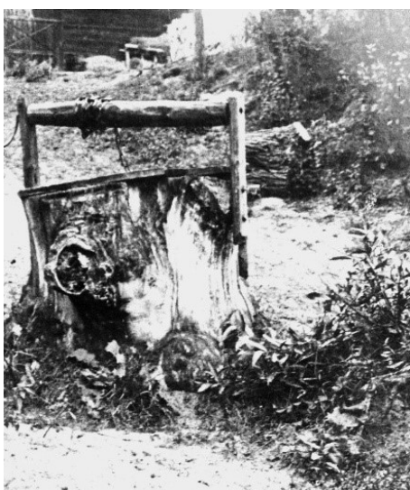
Рисунок 6 – «Колодец в истлевшем дубовом пне в д. Отоки около Медна Брестского повета». 1938 г. Фото

Искусственное преувеличение масштабности как средство усиления эмоционального воздействия на зрителя прослеживается и в самых разных сферах материальной культуры местного населения. Известны колодцы («кадоўб»), надземная часть которых изготавливалась не из сруба, а из одного цельного элемента – части ствола дуба, из которого удалена сердцевина. На таком крупноразмерном дубовом пне, который мог служить десятилетия из-за своей способности противостоять влаге, устанавливали коловорот (рис. 6). В церкви XVII века в агрогородке Войская Каменецкого района в боковых входах в притвор сохранились дверные полотна, являющиеся цельными элементами, а не составленными из отдельных досок (рис. 7). Особые географические условия повлияли на то, что именно здесь сельские поселения самые крупные по численности населения, по сравнению с остальной Беларусью. Этнографами в прошлом зафиксированы самые протяженные погонные усадьбы – до 100 м длиной. Да и в быту полешуки нередко обычные бытовые предметы и устройства, например стационарная, установленная у стены ножная ступа, чтобы растолочь зерно, делали крупными по размерам из цельных частей древесного ствола.