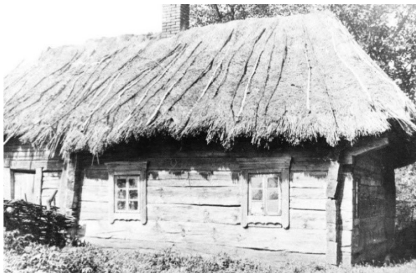
Рисунок 2 – Жилой дом в д. Липово, Кобринского повета. 1937 г.

При обычной высоте стен сруба в 2,3-2,5 м (10-12 венцов, иногда больше) во всех регионах Беларуси и во всех типах построек при наиболее распространенных видах кровли (солома, тростник, гонт, щепя, дранка, позднее черепица и жель) доминировал объем крыши. Некоторое исключение составляли строения с крышей рубленой конструкции, – «сзакотам». Но на Западном Полесье размеры пластин, которые удавалось получить после распиловки дубовых стволов, позволяли обойтись меньшим количеством венцов в срубе жилого дома, – в шесть-семь венцов (рис. 2 и 3), а то и меньше, – до пяти (рис. 4) и даже до четырех венцов (рис. 5) [10, с. 115].