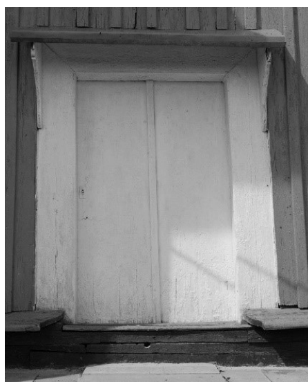
Рисунок 7 – Троицкая церковь в агрогородке Войская Каменецкого района. Дверь бокового входа в притвор. 2010 г.