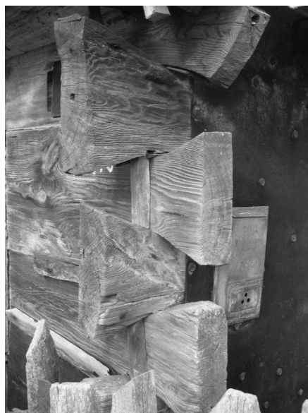
Рисунок 9 – Угол сруба из четырех венцов, усиленный «тэблямі» в доме в д. Октябрь Кобринского района

В народном зодчестве средства построения выразительной художественной формы неизбежно являлись естественным отображением идейно-эстетических и социальных задач, но предопределялись все же конструктивно-техническими особенностями местного зодчества. На Западном Полесье эстетический потенциал функциональных и конструктивных особенностей сооружений также всегда использовался плотниками и был среди основных творческих методов: размещение строения с учетом ориентации по сторонам света, параметры строений, выявление планировки через обоснованное размещение дверных и оконных проемов, оптимальные размеры этих проемов и др. У зрителя строения должны были вызывать не только чувства узнаваемости привычного образа, например жилого дома, или представления об удобном в нем пребывании, но и ощущения основательности, прочности, надежности этого дома. Конструктивная «правда», обозначавшая архитектурную тектоничность, была важным фактором обеспечения образов, выражающих устойчивость бытового уклада и стабильность функциональных процессов. Стены на основе сруба как раз обеспечивали совместное решение практических и художественных задач. Поэтому среди важнейших композиционных средств в народной архитектуре всегда было выявление пластической выразительности структуры бревенчатого сруба, его угловых соединений.