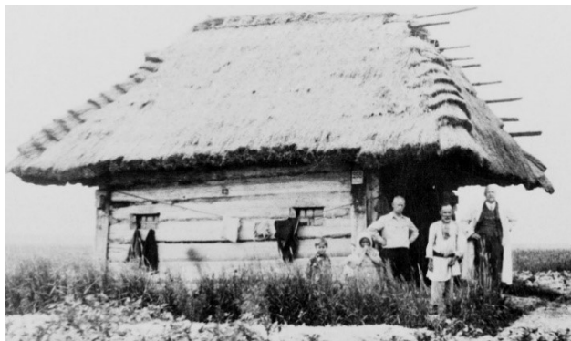
Рисунок 3 – «Курная изба в окрест. Пинска». 1938 г. (Музей Белорусского Полесья. Нв. № 1444/16)