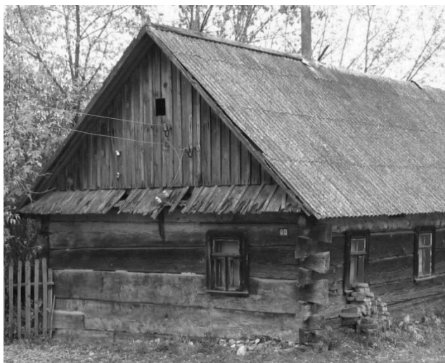
Рисунок 4 – Жилой дом в д. Октябрь Кобринского района. Сруб из пяти венцов. 2005 г