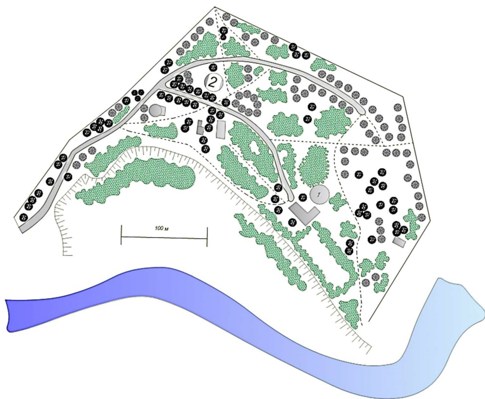
Рисунок 2 – План парка «Маньковичи» 1905 года