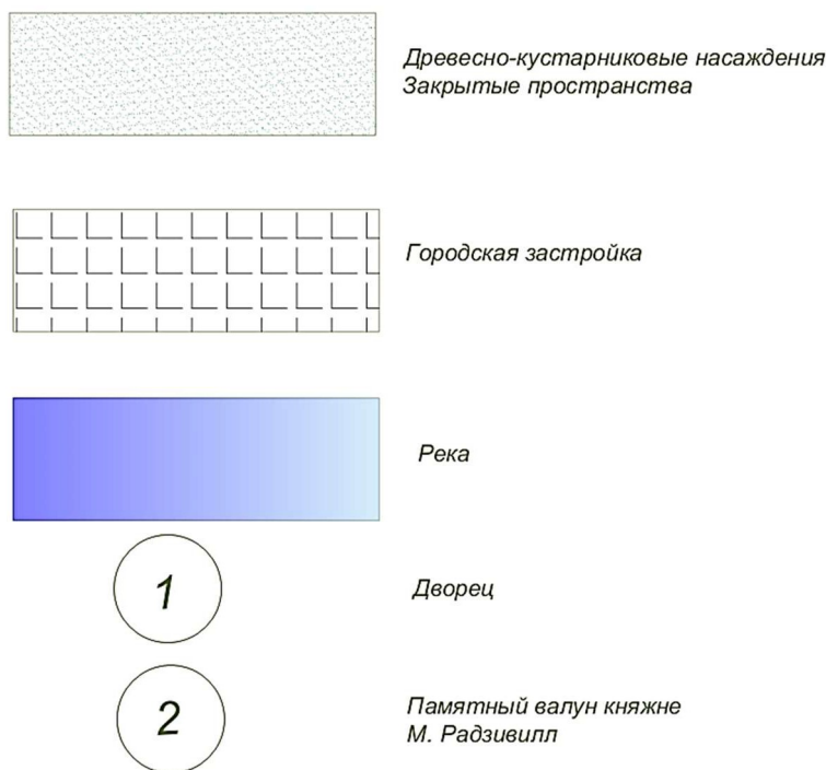
Рисунок 4 – Условные обозначения

Вышеуказанные чертежи были сделаны на основе аэрофотосъемки с помощью квадрокоптера. Невооруженным глазом можно заметить, что на данный момент на территории парка преобладают закрытые пространства (сомкнутость полога составляет около 0,8-0,9). Главные композиционные оси нарушены, лишь одна главная аллея в большей степени осталась неизменной. Единственным композиционным акцентом может служить дуб на поляне при движении вглубь парка в сторону места, где раньше был дворец. И именно при движении по этой аллее открывается оставшиеся видовые точки и перспективы, которые имеют эстетическую ценность.