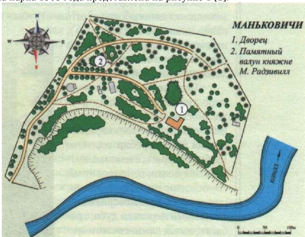
Рисунок 1 – Схема парка «Маньковичи»

Схема парка 1905 года представлена на рисунке 1 [2].