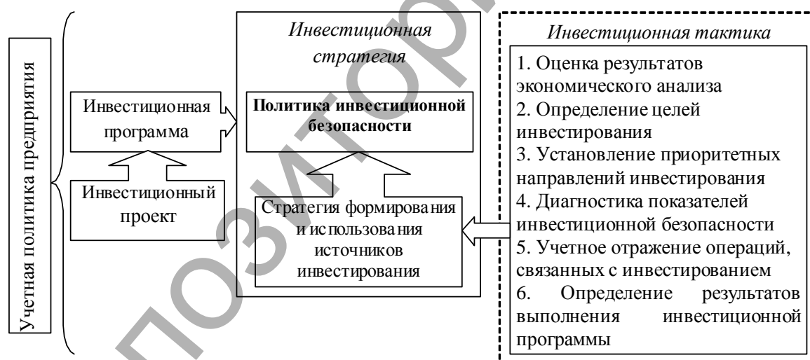
Рис. 2. Механизм реализации учетной политики в части инвестиционной безопасности предприятия

В условиях кризисных процессов при разработке инвестиционной политики важным элементом должен стать анализ инвестиционной безопасности. Диагностика инвестиционной тактики выделена штриховыми линиями, чтобы отметить недостаточность методической разработанности этой проблемы и ее учета при формировании инвестиционной политики. Изучение данной проблемы имеет важное теоретико-прикладное значение, поскольку позволит определить уровень кризисной экономики, что позволит в свою очередь более четко установить цели и задачи инвестиционной политики. Таким образом, на основе инвестиционной стратегии разрабатывается инвестиционная политика, которая находит свое отражение в соответствующих пунктах учетной политики, которые являются основным инструментом реализации инвестиционной политики предприятия [3].