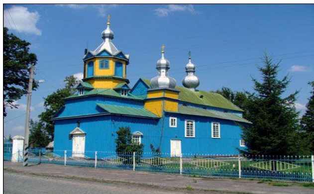
Фота 5. Царква ў імя святога архангела Міхаіла, в. Сцяпанкі