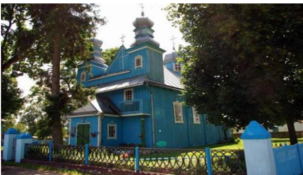
Фота 3 – Царква Параскевы Пятніцы, в. Дзівін