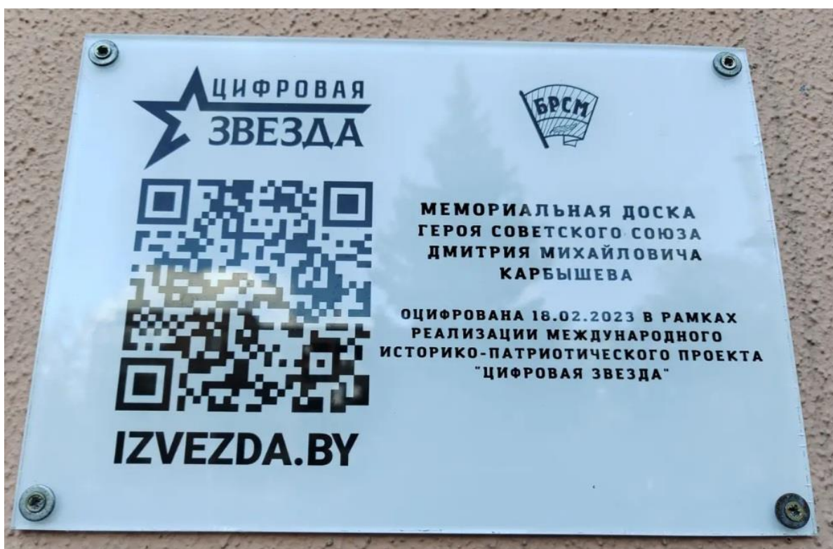
Фото 2 – Мемориальная доска Героя Советского союза Дмитрия Михайловича Карбышева в СШ № 20 г. Бреста