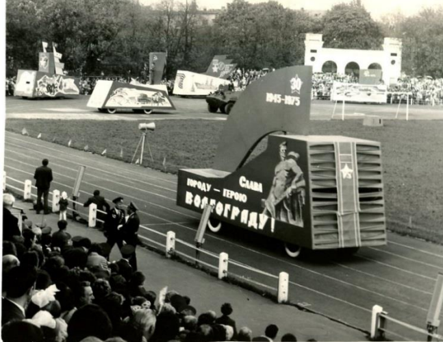
Фота 8 – Свята Перамогі ў Брэсце. 1979 г. Фотаняпера. Фотадрук чорна-белы. КП 615/14

У 1977 годзе таксама быў зроблены здымак скульптурнай кампазіцыі “Кніга Гонару” у брэсцкім гарадскім парку [25].