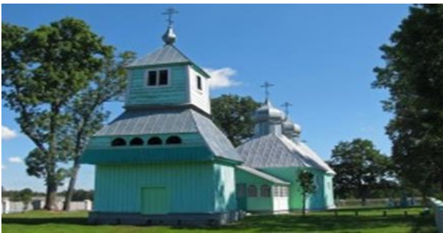
Фота 1 – Міхайлаўская царква, в. Чэрск

характарызуюць найбольш адметныя рысы гісторыка-культурнай спадчыны ўсёй рэспублікі; “3” – гісторыка-культурныя каштоўнасці, якія характарызуюць адметныя рысы гісторыка-культурнай спадчыны асобных рэгіёнаў рэспублікі. Трэба заўважыць, што драўлянае культуравае дойлідства Палесся адносіцца да “0” катэгорыі. Асаблівай унікальнасцю, з пункту гледжання даследчыкаў, адрозніваюцца такія царквы як: Міхайлаўская царква са званіцай 1701 г. у в. Чэрск (Брэсцкі раён) (фота 1), Мікіцкая царква са званіцай в. Здзітава (Жабінкоўскі раён, пабудавана ў 1502, год апошняй перабудовы 1787) (фота 2), Царква Параскевы Пятніцы са званіцай 1740 г. у в. Дзівін (Кобрынскі раён) (фота 3), Царква ў імя святой вялікапакутніцы Параскевы Пятніцы ў в. Збірагі (Брэсцкі раён, 1610 г.) (фота 4), Царква ў імя святога архангела Міхаіла ў в. Сцяпанкі (Жабінкоўскі раён, 1780 г.) (фота 5).