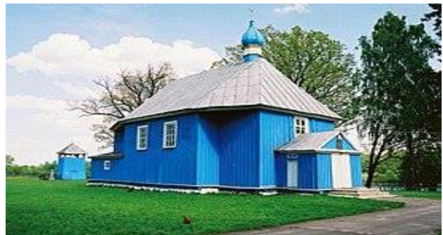
Фота 2 – Мікіцкая царква, в. Здзітава