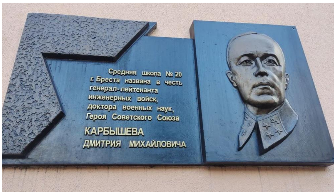
Фото 1 – Мемориальная доска учреждения образования «Средняя школа № 20 г. Бреста имени Героя Советского Союза Д. М. Карбышева»

В воспитании у детей и молодёжи гражданской культуры, таких личностных качеств как человеческое достоинство, мужество, патриотизм, целеустремлённость важное значение имеет пример. Человек, вызывающий уважение, восхищение, а нередко, и поклонение, рождает желание следовать его примеру, хранить память о нём, передавая её потомкам. Таким героем для нас, выпускниц 20-й школы г. Бреста, стал Герой Советского Союза Д. М. Карбышев (фото 1).