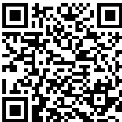
Рисунок 1. Ссылка на виртуальную экскурсию в школьный музей имени Д. М. Карбышева (г. Камышин, Россия).

Один из российских школьных музеев в г. Камышине, посвящённых этому же деятелю, также предлагает QR-код, чтобы загрузить экскурсионный тур и ознакомиться с экспозицией (рис. 1) [4].