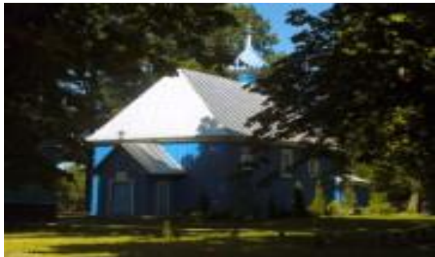
Фота 4 – Царква ў імя святой Вялікапакутніцы Параскевы Пятніцы, в. Збірагі