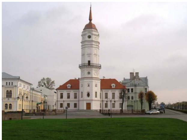
Рисунок 3 – Возрождённая Могилёвская ратуша

ностей. Воспроизведён образ утраченного памятника. Этому способствовало то, что новое здание выстраивали по сохранившимся чертежам. Был выбран именно тот вид объекта архитектуры, который соответствовал сохранившемуся окружению. Точный повтор здания 1773 г., когда ратушу перестроили и придали ей вид в соответствии с остальным ансамблем губернских учреждений, позволил удачно вписаться в архитектурное окружение. Воспроизведены конструктивные особенности предшествующего объекта архитектуры, частично применены строительные материалы аналогичные подлинным. Здание является достоверной копией оригинала. Это по-прежнему доминанта в застройке центра Могилёва (рисунок 3).