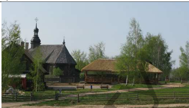
Рисунок 8 – Взаимосвязь со средой в «Белорусском государственном музее народной архитектуры и быта»