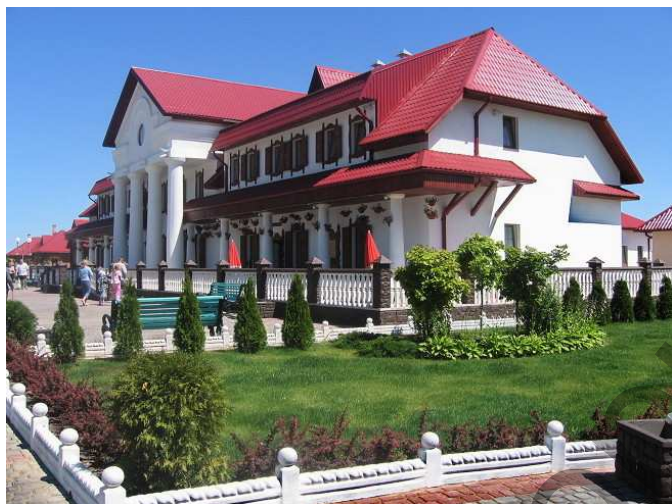
Рисунок 6 – «Белорусская этнографическая деревня XIX века»

стадию цивилизации, который отмечается в современное время, имидж становится важным коммуникативным средством в отличие от образа. Имидж опустошает символы, лишает их правды образа [9, с. 38–41]. В «Белорусской этнографической деревне XIX века» дискредитации подвергнуты не только объекты архитектуры, но и природная среда. Понятие возрождаемого ландшафта сводится к вымощенным современными плитками дорожкам и высаженным вокруг них экзотическим цветам. Воссоздание в таких объектах ограничивается стилизацией под старину. Вновь сооруженные строения имеют функцию развлекательных объектов. Здесь уже даже не пытаются повторить особенности исторической постройки или технику её возведения, как и воссоздать былое окружение (рисунок 9). И всё это маскируется под воссоздание культурно-исторической среды, сохранение и реконструкция которой – это не просто её музеефикация. Эта среда должна быть органичной, контекстуальной как в «Белорусском государственном музее народной архитектуры и быта» (рисунок 7), где памятники объединены в группы с целью воссоздания быта усадьбы или крестьянского хозяйства (рисунок 8).