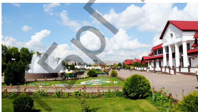
Рисунок 9 – «Белорусская этнографическая деревня XIX века», ландшафт

Заключение. В результате анализа выявлены воссозданные сооружения в Беларуси с разной глубиной трансляции образа утраченного памятника архитектуры. Это здания: копии (в которых осуществлено достоверное повторение архитектурной формы сооружения без воспроизведения его образа); макеты (сооружения в которых искажаются размеры, отсутствуют конструктивные и функциональные особенности утраченного здания); знаки (которые только обозначают объект, но их формы не наполнены смыслом); новоделы (сооружения из новых строительных материалов, дискредитирующие историю, выдавая новое за старое); символы (разновидность зданий, которые воспроизводят общественную ценность и передают в осмысленной форме древние установки этноса в различных сферах).