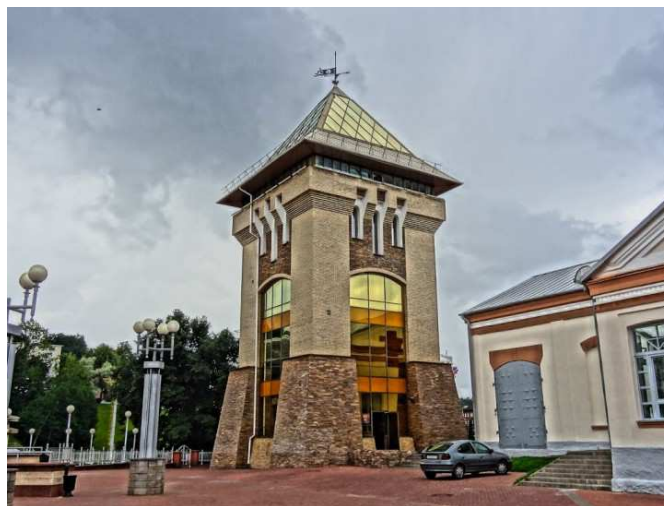
Рисунок 5 – «Духовской круглик» в Витебске

4. Здания-знаки. Есть знаки, которые только обозначают объект, то есть их формы не наполнены смыслом, а есть и такие, которые превращены в символы, транслирующие глубину образа. Здание-знак – это «Духовской круглик» в Витебске (рисунок 5). Он выстроен без повторения образа древнего объекта. Существование возрождённых строений в виде стилизованного здания возможно, если они осуществляют функции объекта архитектуры, защищающего остатки фундамента. При воспроизведении в Витебске «Духовского круглика» возвели стилизованную постройку на месте фундамента существовавшего ранее памятника, которая носит название здания, чьи архитектурные особенности трактуются в искажённом, стилизованном виде. Если такое воссоздание имеет место, в сознании людей наступает подмена утраченного строения вновь возведённым объектом архитектуры в упрощённом виде. Это является так же недопустимым, так как даёт неправильное представление о формальных, конструктивных, технологических качествах древнего здания.