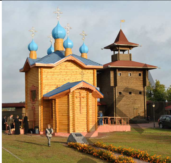
Рисунок 4 – Церковь Преображения в Мозырском замке

4. Здания-знаки. Есть знаки, которые только обозначают объект, то есть их формы не наполнены смыслом, а есть и такие, которые превращены в символы, транслирующие глубину образа. Здание-знак – это «Духовской круглик» в Витебске (рисунок 5). Он выстроен без повторения образа древнего объекта. Существование возрождённых строений в виде стилизованного здания возможно, если они осуществляют функции объекта архитектуры, защищающего остатки фундамента. При воспроизведении в Витебске «Духовского круглика» возвели стилизованную постройку на месте фундамента существовавшего ранее памятника, которая носит название здания, чьи архитектурные особенности трактуются в искажённом, стилизованном виде. Если такое воссоздание имеет место, в сознании людей наступает подмена утраченного строения вновь возведённым объектом архитектуры в упрощённом виде. Это является так же недопустимым, так как даёт неправильное представление о формальных, конструктивных, технологических качествах древнего здания.