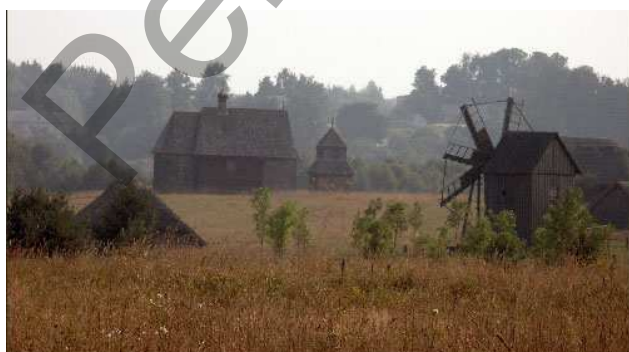
Рисунок 7 – «Белорусский государственный музей народной архитектуры и быта»

Если о вновь возведенном здании заявляют как о символе создаваемого памятника, не следует вводить в его облик какие-либо существенные изменения. Памятник нужно воспроизводить из тех же строительных материалов, использовать те же технологические приемы, которые применялись при строительстве оригинала. Обозначение объекта как новодел может быть чисто условным. Достаточно совпадения места возведения, или нескольких форм, или функции. Все эти элементы должны быть возрождены вместе. Целостное воссоздание – это воссоздание не только формы, конструкции, пространственной композиции, но и образа архитектурного объекта. Символ вещи – это ещё не сама вещь. Мыслительный процесс превращает объект в символ. При воссоздании объекта архитектуры важно постигнуть идею построения художественной формы, пространства и передать их [3, с. 36].