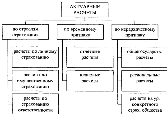
Рисунок 1 – Классификация актуарных расчетов

Актуарные расчеты можно классифицировать по отраслям страхования, по временному признаку, по иерархическому признаку.